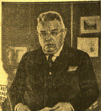
Max Halbe feiert seinen 70. Geburtstag

Der bekannte deutsche Dichter und Schriftsteller Max Halbe wurde am 4. Oktober 1865 in Quettland (Westpreußen) geboren, feiert also in diesen Tagen seinen 70. Geburtstag. Der Dichter verbandt seine besondere Berühmtheit den packenden Dramen, die er für das Theater schrieb, und die für den Naturalismus von ausschlaggebender Bedeutung waren.