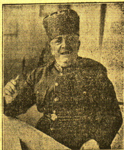
Türkischer General — abessinischer Oberkommandeur

Der türkische General Wabib Pascha wurde zum Oberkommandeur der abessinischen Südront ernannt und befindet sich zur Zeit im Hauptquartier der Südront in Nialiga. General Wabib Pascha war im Weltkrieg Befehlshaber der türkischen Flotte, die die Dardanellen gegen die Engländer verteidigte.