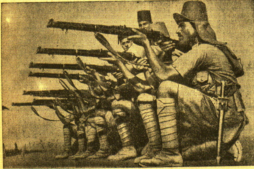
Auch Aegypten trifft militärische Vorbereitungen für einen etwaigen Kriegsfall Angeht die drohende Kriegsgefahr in Nord-Afrika herrscht naturgemäß auch in Aegypten eine gewisse Nervosität. In der Nähe von Kairo bei Abbasiya wurden großen Manövern durchgeführt, an denen Tausende von ägyptischen Soldaten teilnahmen. Man sieht hier ägyptische Infanteristen bei Schießübungen.