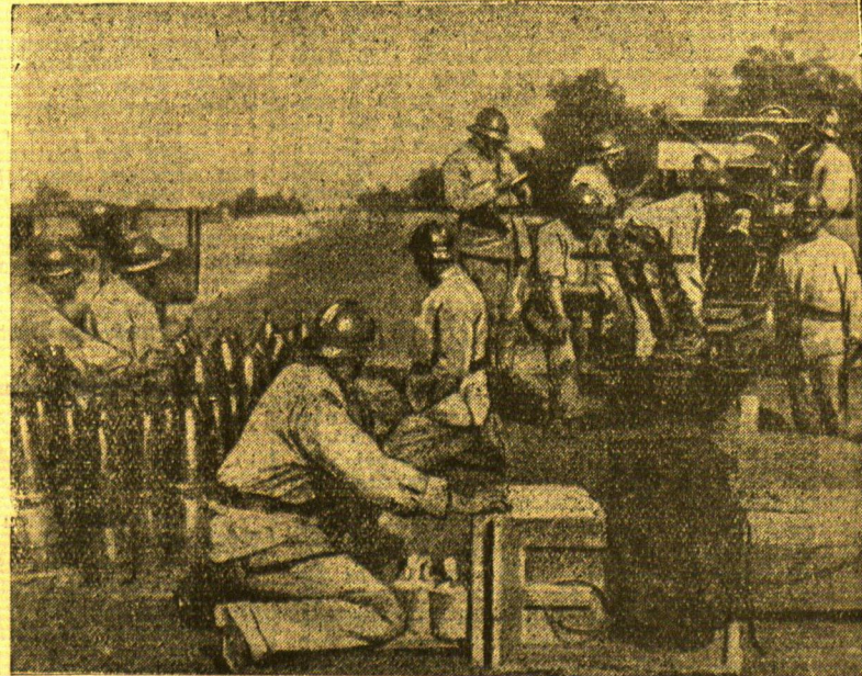
Französisches Geschütz beim Feuern Nach den Manövern bei Mailly begannen jetzt die großen französischen Manöver an der oberen Marne. Hier sieht man ein mittleres französisches Geschütz beim Feuern.