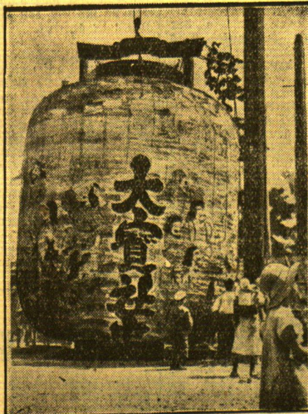
Die größte Laterne der Welt hing bei dem diesjährigen Laternenfest, einem Nationalfest in Japan, in den Straßen Tokios.