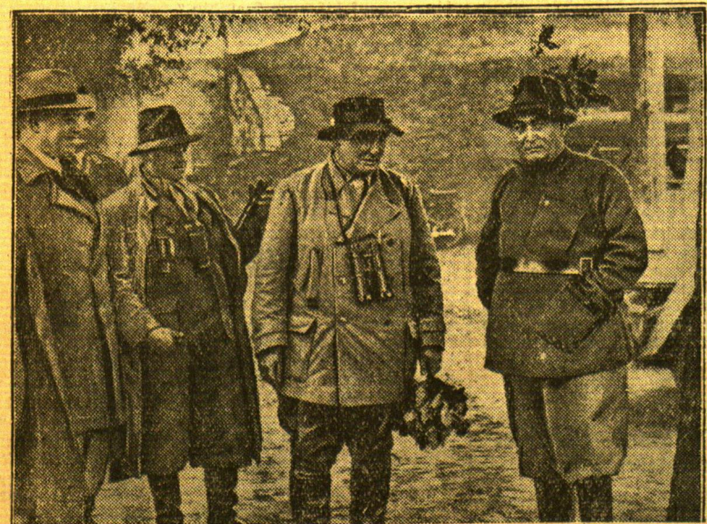
Ungarns Ministerpräsident Gömbös auf der Jagd in Dänemark Der ungarische Ministerpräsident Gömbös weilte als Gast des preußischen Ministerpräsidenten Goering in der Romintener Heide zur Jagd. Unser Bild zeigt die Jagdgeellschaft, von rechts nach links: Ministerpräsident Gömbös, Ministerpräsident General Goering