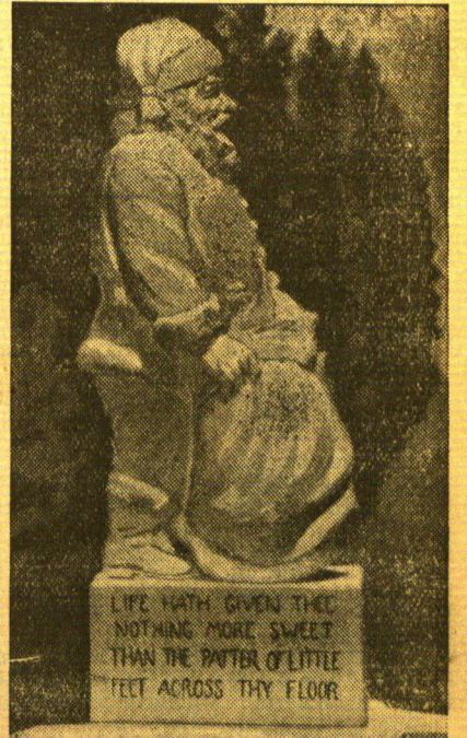
LIFE HATH GIVEN THEE NOTHING MORE SWEET THAN THE PATTER OF LITTLE FELT ACROSS THY FLOOR

Das erste Denkmal für den — vor allem bei den Kindern — beliebtesten St. Nikolaus errichtete die amerikanische Stadt Santa Claus. Es ist eine 7,50 Meter hohe Statue, die in einem Park der Stadt Aufstellung findet