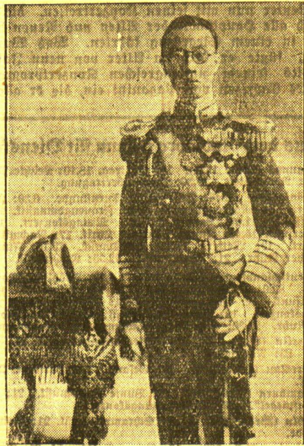
Der Kaiser von Mandchukuo in Admiraluniform. Bei der großen Marineparade, die soeben auf dem Sungari-Fluß in Mandchukuo stattfand, zeigte sich Kaiser Rangteb zum erstenmal in der Uniform eines mandchurischen Admirals.

Berlin, 30. September. Zu Ehren des ungarischen Ministerpräsidenten fand am Sonntag eine Reihe von Empfängen und Veranstaltungen statt.