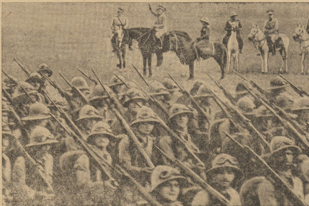
Pierwsze, jakie trafiło do Europy, zdjęcie z głównej włoskiej kwatery wojennej w Asmarze (Erytrea): dowódca włoskich sił zbrojnych w Afryce wschodniej, gen. de Bono (z podniesioną ręką) dokonuje przeglądu jednego z oddziałów. Na lewo od niego gen. Graziani.