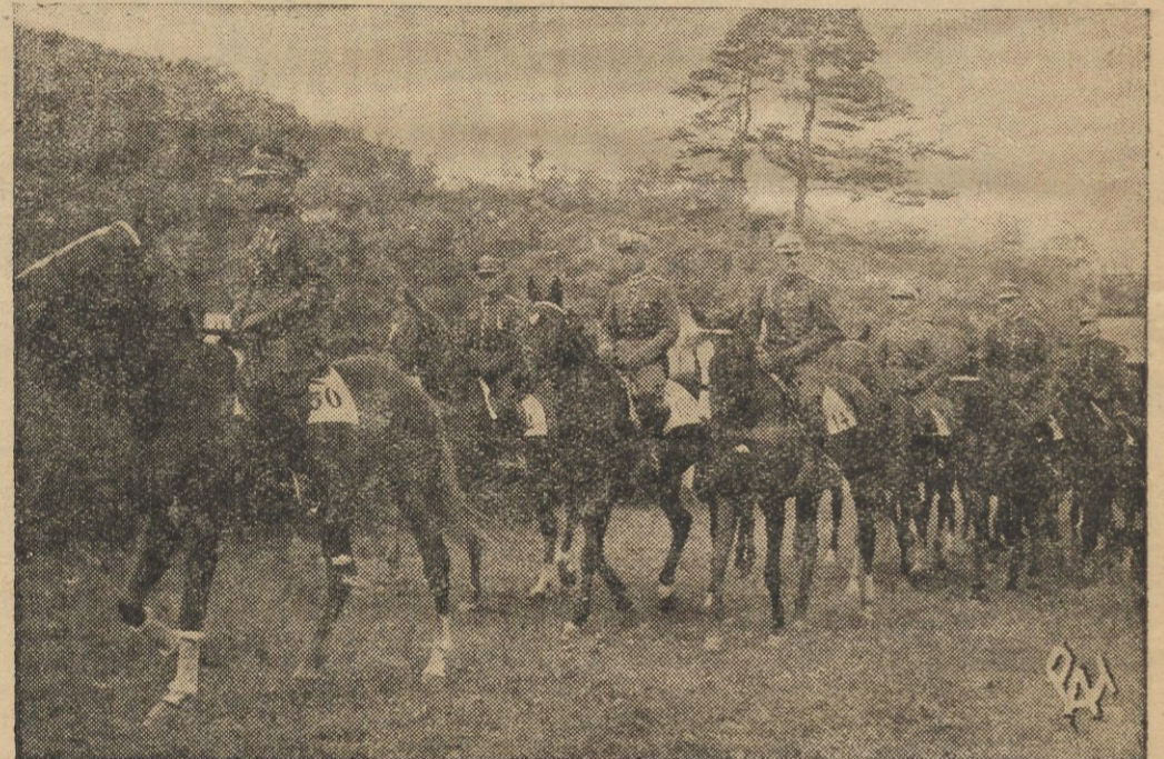
Ekipa polska przed defiladą.

Z międzynarodowych zawodów konnych w Warszawie