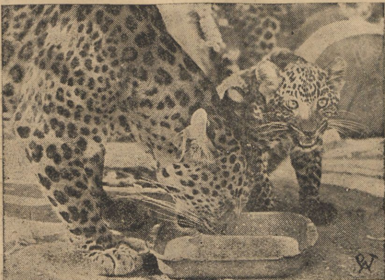
Śniadanie w Zoo

Społeczeństwo w zrozumieniu olbrzymich potrzeb i konieczności zbliznienia naszego szkolnictwa powszechnego, do poziomu szkolnictwa w zachodniej Polsce, winno w obecnym „Tygodniu“ zdobyć się na wielki naprawdę wysiłek, winno zdobyć się na słuszną i konieczną ambicję, by wyniki finansowe „Tygodnia“ nie zawiodły oczekiwań. Poparcie zbiorów ulicznych, masowe wstępowanie do Kół T. P. B. S. P., udział we wszystkich imprezach — oto drogi, któremi ofiarność społeczna zdążać winna w „Tygodniu“. W świadczeniach na rzecz „Tygodnia“ wziąć winno udział całe społeczeństwo. Nikogo nie powinno zabraknąć przy spełnieniu tego najistotniejszego i najpilniejszego obowiązku obywatelskiego, jeśli nie chcemy w wyścigu kulturalnym narodów pozostać daleko w tyle.