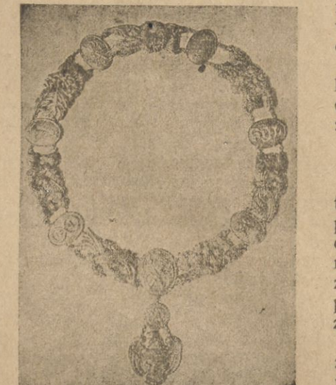
Łańcuch rektorski w-g projektu prof. F. Rusczyca. Dar miasta Wilna

Organizowanie uroczystości wymagało ogromnego wysiłku, no i wielkich funduszy.