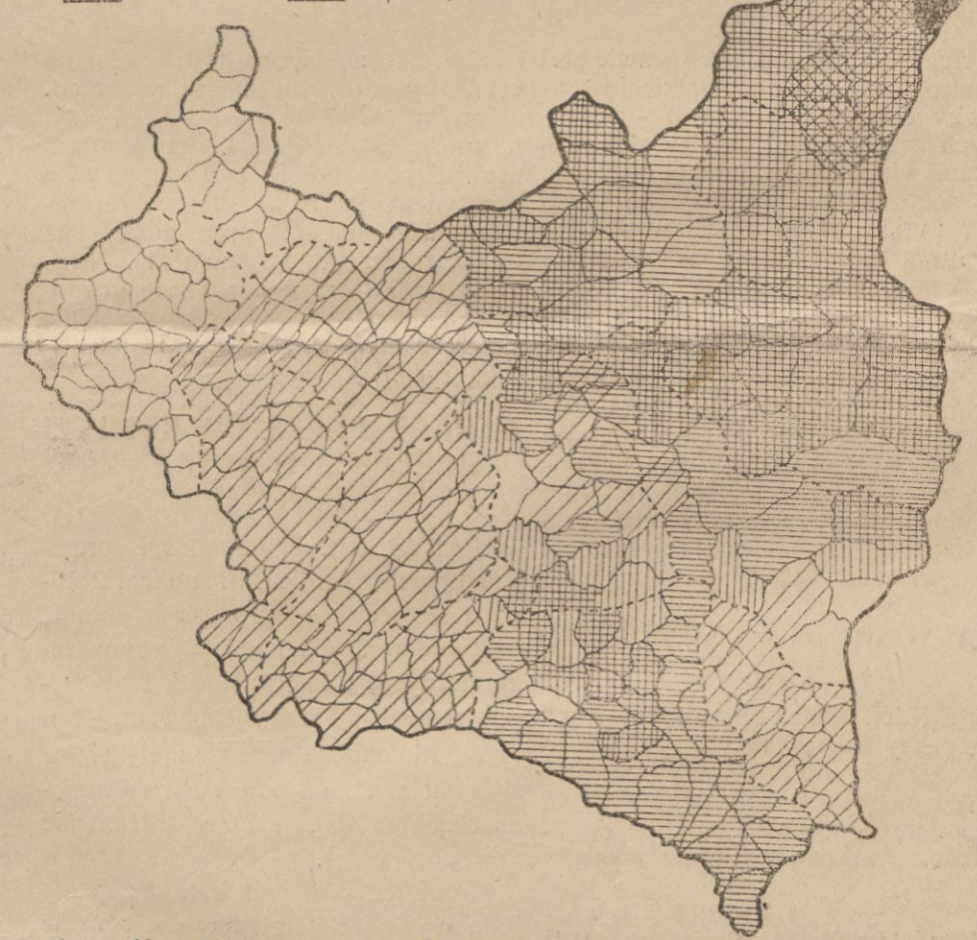
% gruntów obsianych lmem w stosunku do całkowitego obszaru pod zasiewem roślin uprawnych w 1929 r.

mysłową rośliną, którą tak można uprawiać, jest on nią również ze względu na stosunek lnu do warunków hydrologicznych, gdyż posiadając niegłęboko sięgający i mało rozwinięty system korzeniowy, stosunkowo lepiej od innych roślin daje się siać na ziemiach podmokłych i płytko uprawianych. Z prac rosyjskich badaczy nad dynamiką rozwoju uprawy lnu w niedalekim rejonie Pskowskim, jak również z obserwacji w naszych lniarskich rejonach, wynika, że równoległe ze wzrostem uprawy lnu, zwiększa się zasiew koniczy, co bezsprzecznie wpływa bardzo dodatnio na rozwój hodowli bydła mlecznego. Zasiewy koniczy będą się zwiększały, ponieważ obszar nowin odłogów na których również się tu len, maleje.