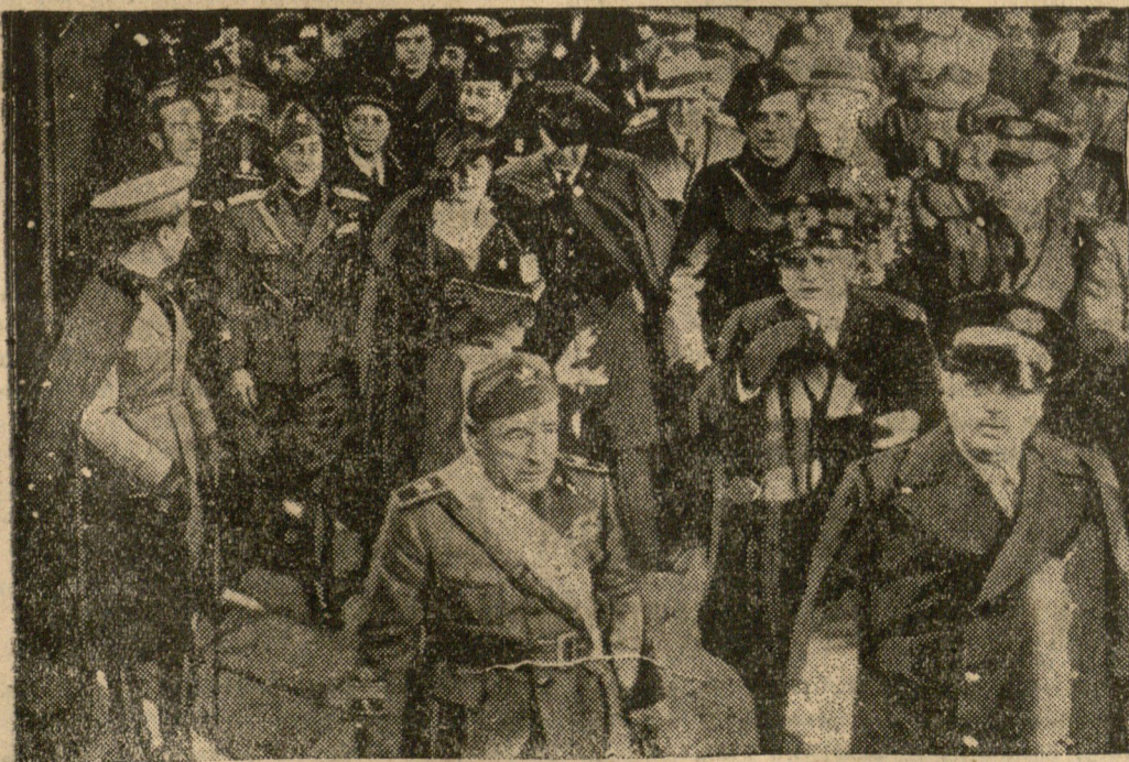
Z Neapolu odpłynął statek „Leonardo da Vinci” wioząc kilku wybitnych faszystów na teren walk w Abisynji. Między innymi na pokładzie statku odpłynął generalny sekretarz partii faszystowskiej, Achille Starace, minister Ciano, Bonomi i inni. Na zdjęciu odprowadzanie dygnitarzy faszystowskich na statek