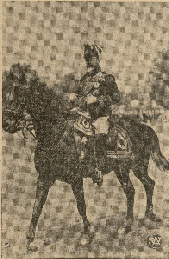
Jerzy V król angielski, zmarły wczoraj