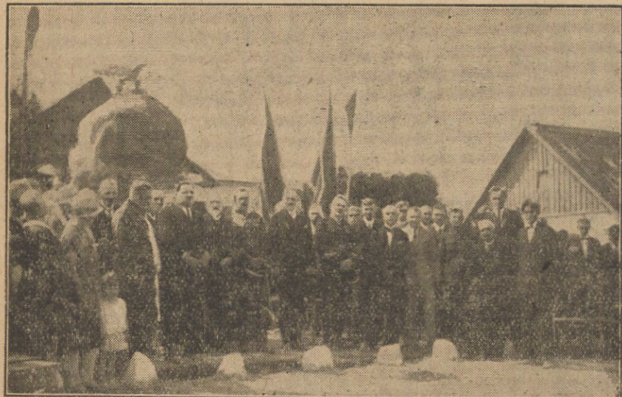
Komitet, władze i organizacje w chwili poświęcenia pomnika - skały w Podbrzeziu.