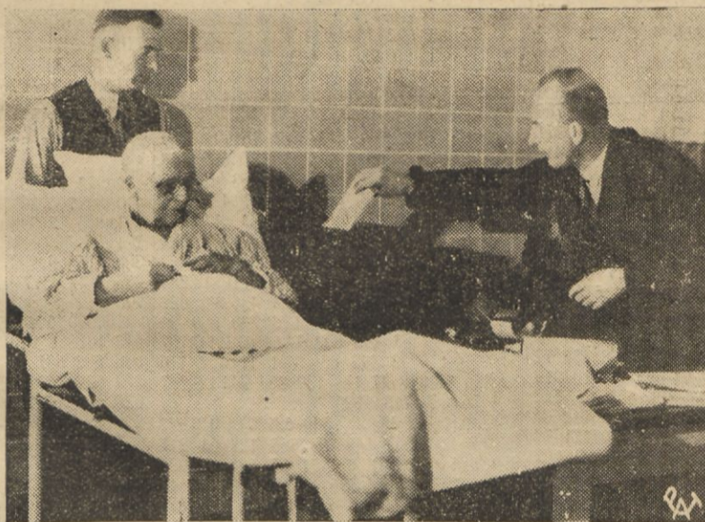
Celem umożliwienia głosowania w Zagłębiu Saary oboźnie chorym, urny wyborcze przenieszone są do szpitali. Na zdjęciu — chora składa swój głos.