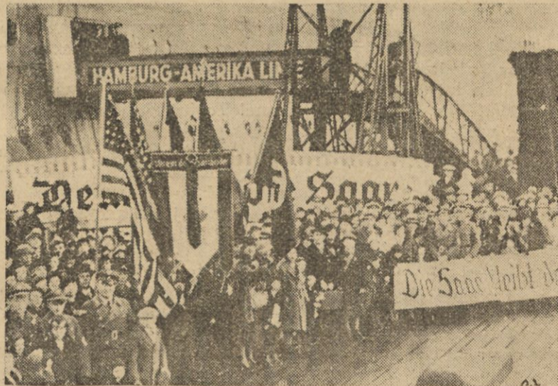
Do Hamburga przybyła w tych dniach z Ameryki większa ilość b. mieszkańców Zagłębia Saary, celem wzięcia udziału w głosowaniu. — Na zdjęciu — grupa b. mieszkańców Zagłębia Saary po wylądowaniu w porcie Hamburgskim, udająca się do Saary.

(Jak wiadomo, wyniki głosowania nie zostaną opublikowane w poniedziałek, a dopiero we wtorek rano. Decyzja ta poddyktowana jest, jak przypuszczają, względami na bezpieczeństwo, by nie do puścić do rozruchów, gdy w godzinach wieczornych, wolnych od pracy, ulice są zapelnione).