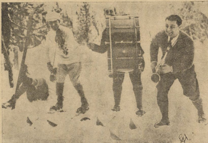
W jednej z modnych miejscowości górskich w Szwajcarii zespół jazzbandowy gra jeżdząc na nartach.