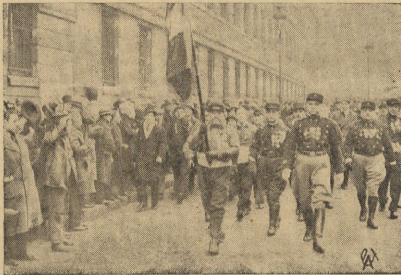
Powracającego z Rzymu po podpisaniu układu francusko — włoskiego min. Spraw Zagranicznych Laval'a powitał manifestacyjnie na dworcu m. in. Legion Girebałdyczków.