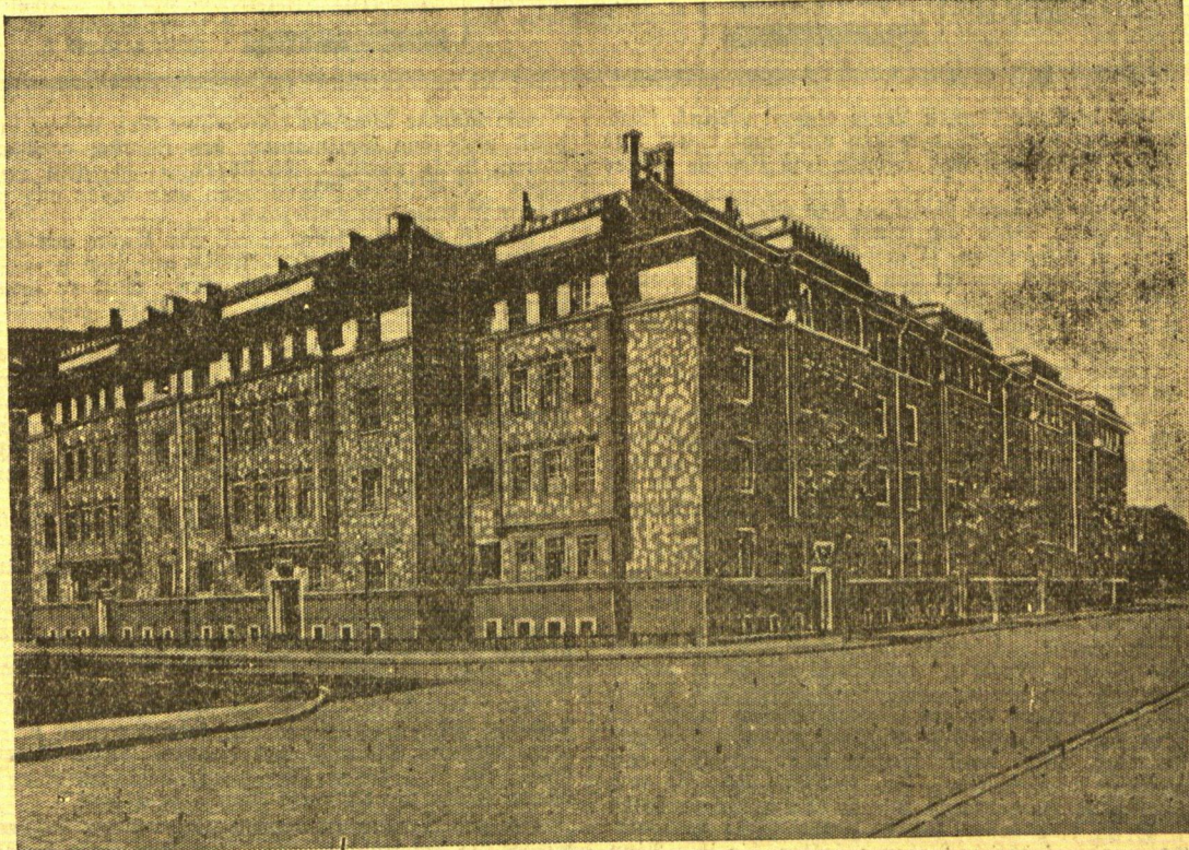
„Memeler Straße“ in deutschen Städten