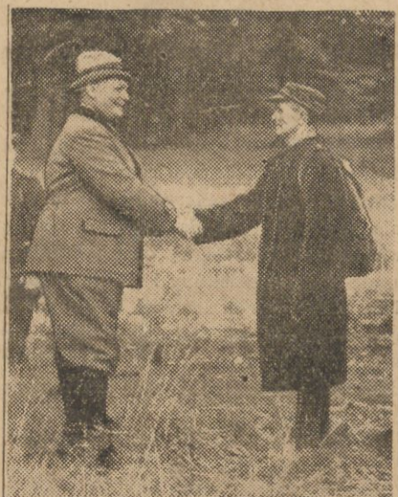
Premjer Goering, sfotografowany podczas inspekcji niemieckich lasów państwowych, gdy podaje rękę robotnikowi.