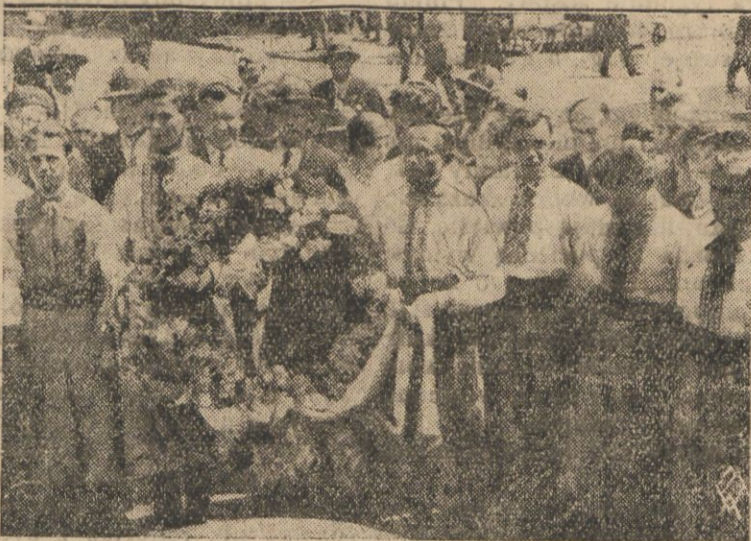
Od kilku dni bawi na Pomorzu wotyński chór „Ridna Chata” koncertując po większych miastach pomorskich. Między innymi chór ten koncertował w Toruniu. W czasie pobytu w Toruniu chór