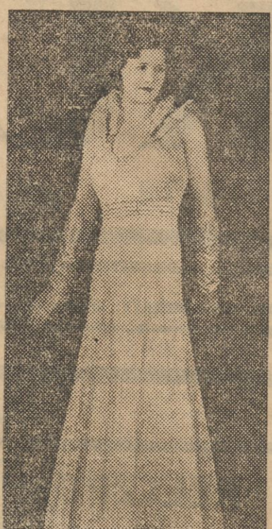
Suknia z białej haftowanej organidyny z rękawami i rekawiczkami z białej tafty.