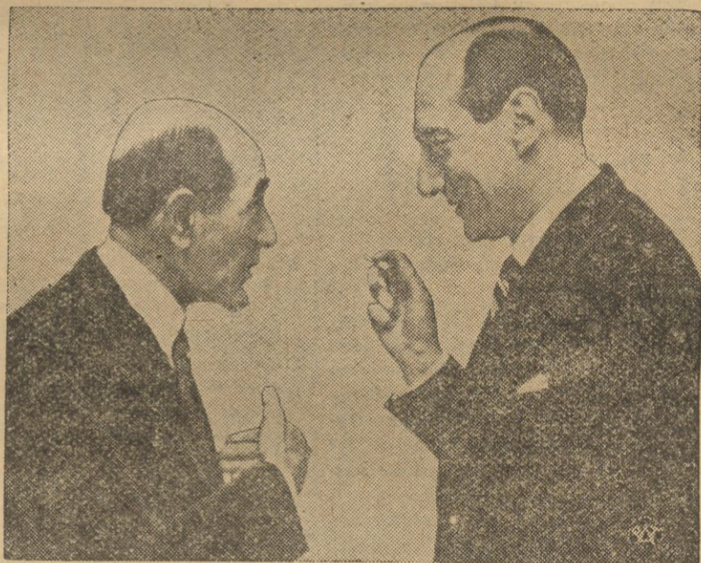
Minister spraw zagranicznych Polski, Józef Beck, w czasie ożywionej rozmowy w kuarach pałacu Ligi Narodów z ministrem spraw zagranicznych Rumunii p. Micescu