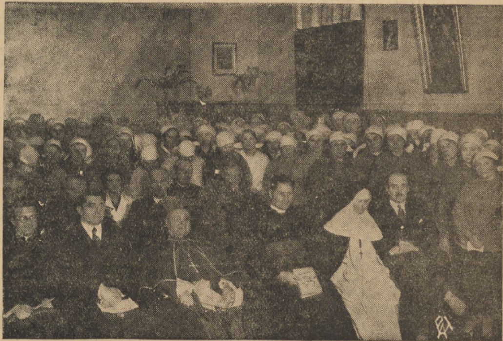
Onegdaj z okazji ukończenia rekolekcji wielkonożnych w więzieniu karnym dla kobiet przy ul. Dzielnej nuncjusz apostolski odprawił Mszę Świętą i udzielił Komunii Św. Na zdjęciu — moment Akademii w więzieniu w obecności Nuncjusza.