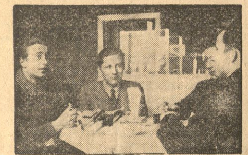
Przy śniadaniu opowiadają chłopcy swe wrażenia z kolonii zimowych.

Tegoroczna akcja zimowych kolonii leczniczo-wypoczynkowych, organizowanych przez ZUS i poszczególne Ubezpieczalnie Społeczne wespół z Okręgowymi Urzędami W.F. i P.W. dla 3.200 robotnic i młodocianych robotników — znajduje się już w pełnym toku. W określonych terminach, tura za turą wyjeżdża w okolice podgórskie na 14-dniowy pobyt wypoczynkowy.