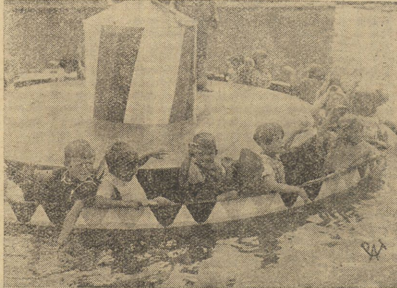
W jednym z ogrodów dziecięcych w Szwajcarii zainstalowano rozkoszną rozrywkę: karuzelę na wodzie, która z miejsca zdobyła sobie tłumy entuzjastycznych zwolenników.