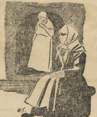
ŚLUCHOWISKO RADJOWE we czwartek dnia 8. VIII o godz. 21.30