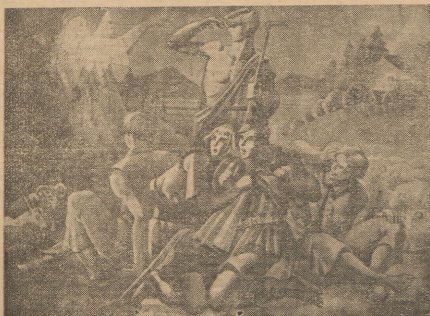
„Anioł pasterzom mówił...”