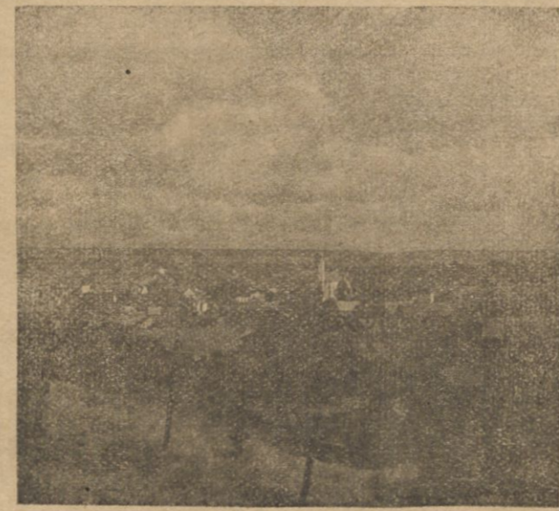
SŁONIM -- widok ogólny.

Z okazji uroczystości miejskich, zarząd miasta wydaje raut w dniu 11 listopada o godzinie 21-szej. Wstęp za zaproszeniami.