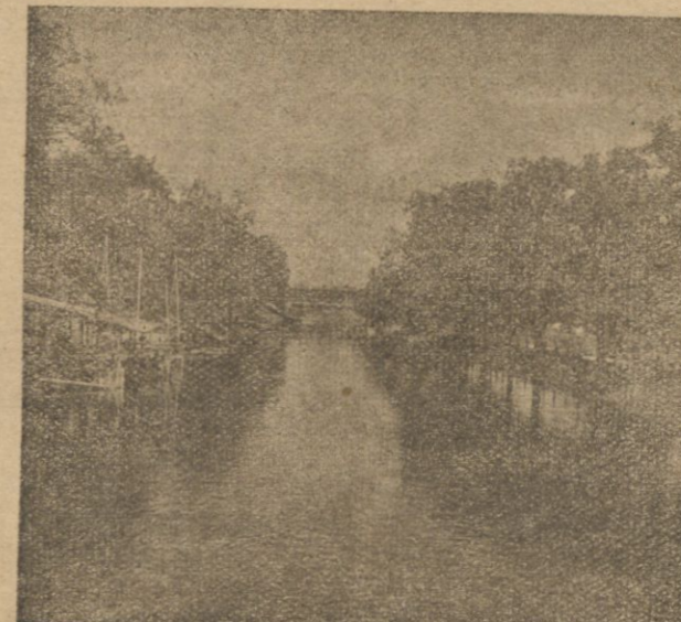
SŁONIM -- Kanał.