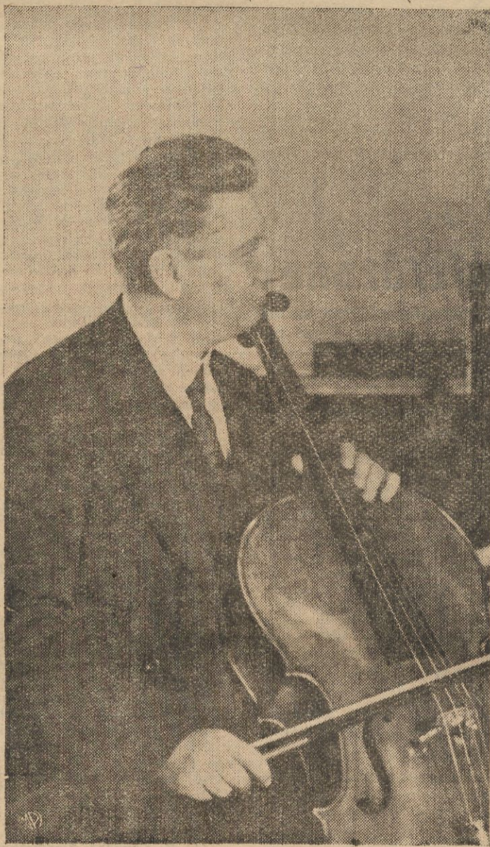
światowej sławy wirtuoz-wiolonczelista, którego koncert odbędzie się dziś o godz. 8 min. 30 w Teatrze na Pohulance w Wilnie.