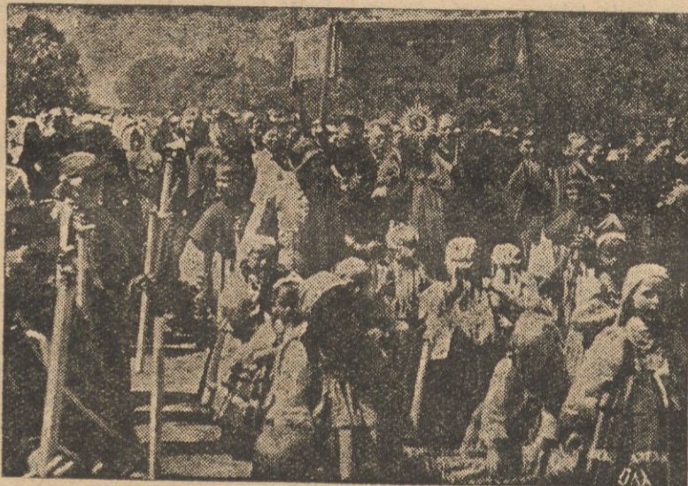
Fragment tegorocznej tradycyjnej procesji w Złakowie Książackim, koło Łowicza.