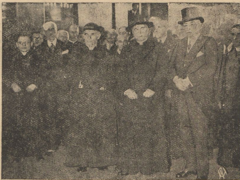
Prymas Polski ks. kardynał Hlond przybył do Paryża celem złożenia wizyty kardynałom francuskim. Na zdjęciu Prymas Polski na dworcu