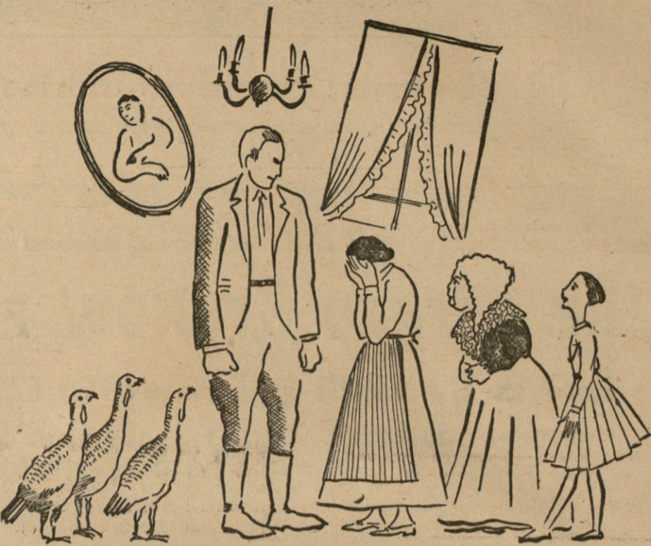
„Spadkobierca” — wśród indyczek