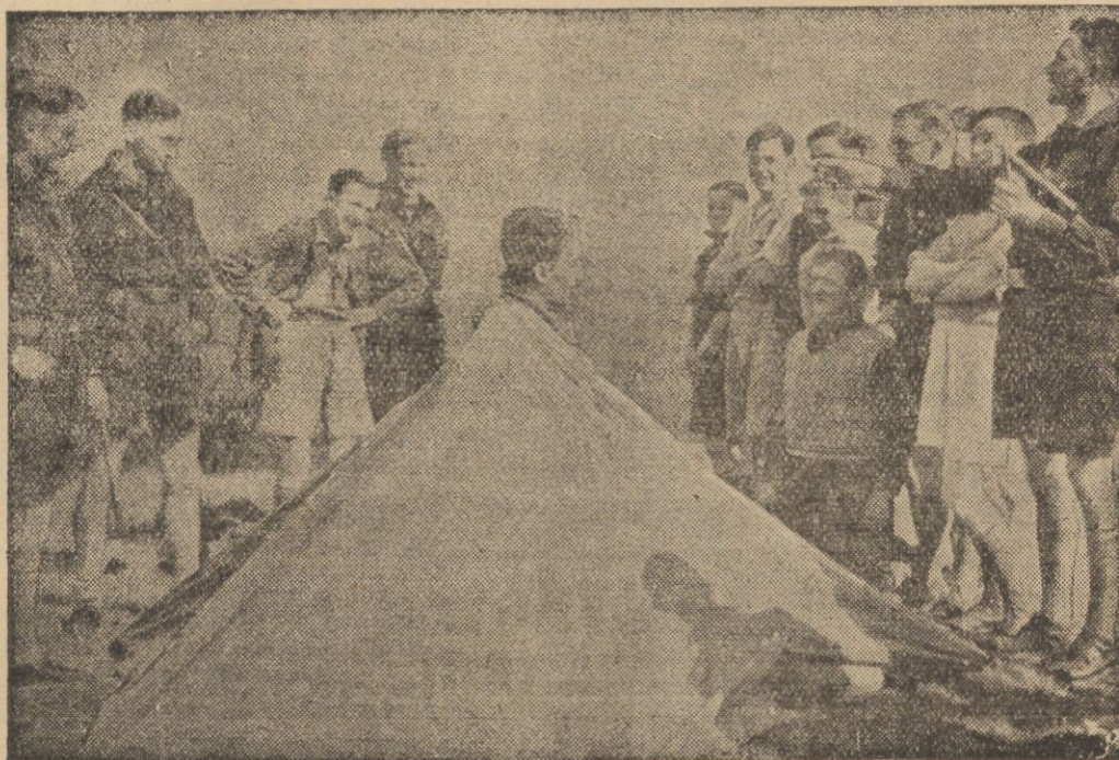
Przed kilku dniami bawiło w Anglii 30 harcerzy niemieckich, którzy w przyjaznym i beztrudnym nastroju spędzili kilka dni wśród angielskich harcerzy. Na ilustracji pokaz budowania namiotu.