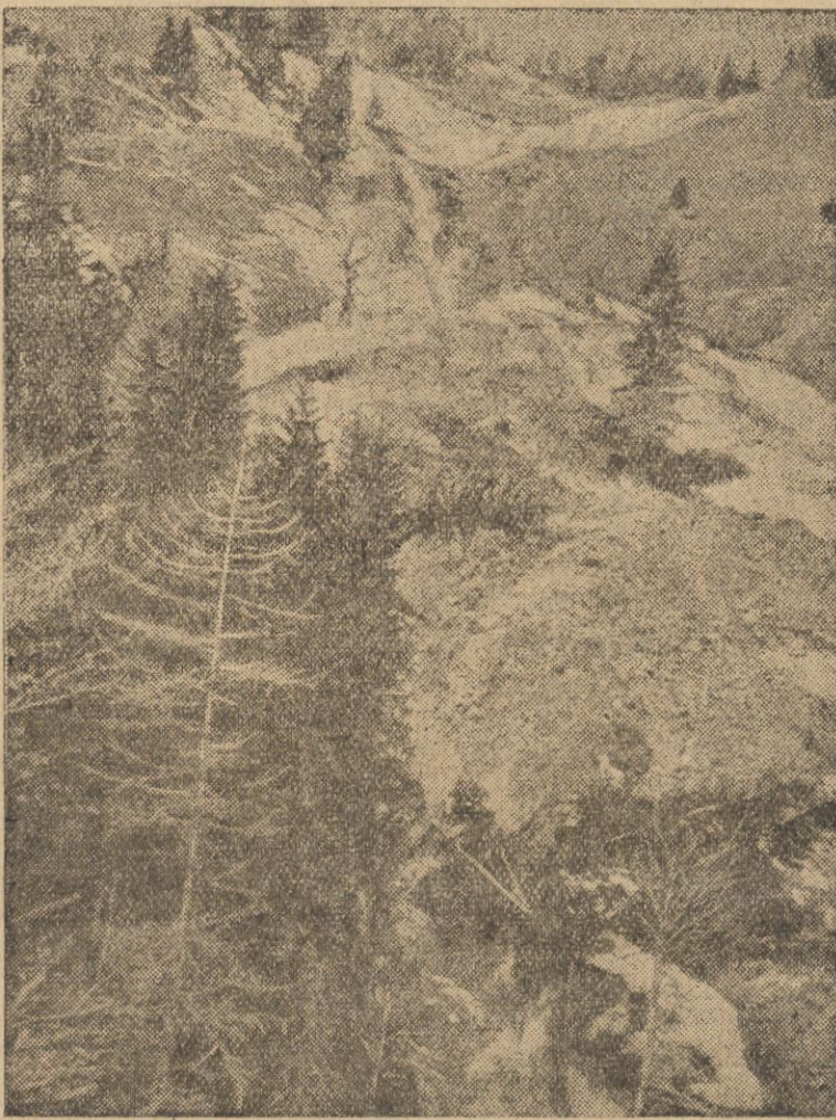
W jednej z miejscowości w Bawarii miało miejsce obsunięcie się góry, przyczem runęło półtora miliona metrów sześciennych skał kamieni i ziemi, niszcząc wszystko na swojej drodze.