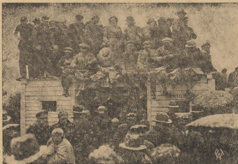
Tylko narciarze uradowali się nagłą zmianą pogody.