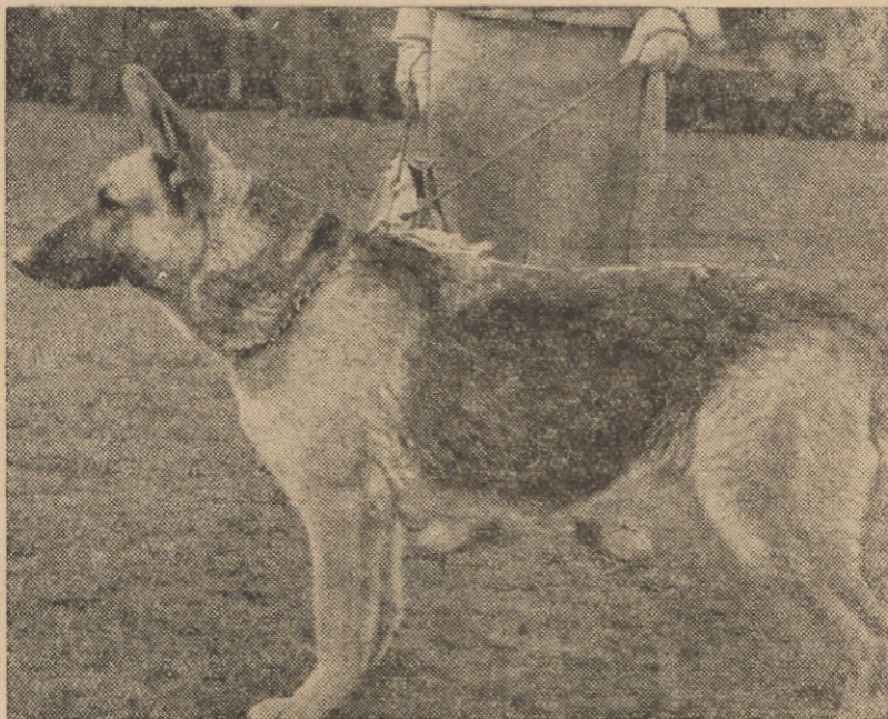
Rozstrzygająca walka o tytuł „najlepszego psa świata“, która rozegrała się na światowej psiej wystawie w Frankfurt nad Menem, przyniosła zwycięstwo małemu angielskiemu Cockerowi. Drugie miejsce uzyskał niemiecki wilczur Stella.