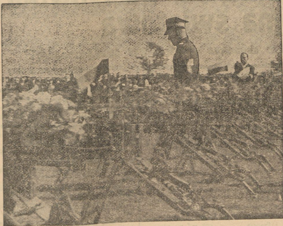
Naczelnny Wódz Pan Marszałek Polski Edward Smigły-Rydz wśród ofiarowanego armii sprzętu wojennego.