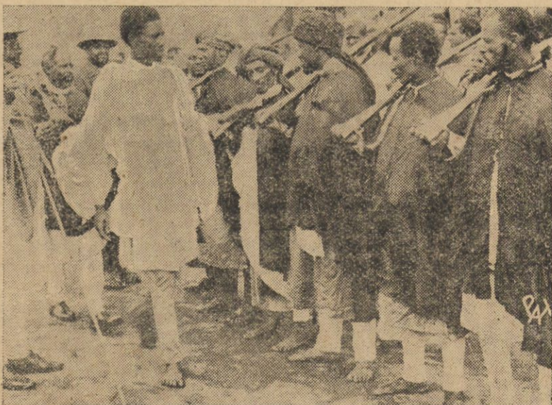
Inspekcja grup ochotników abisyńskich.