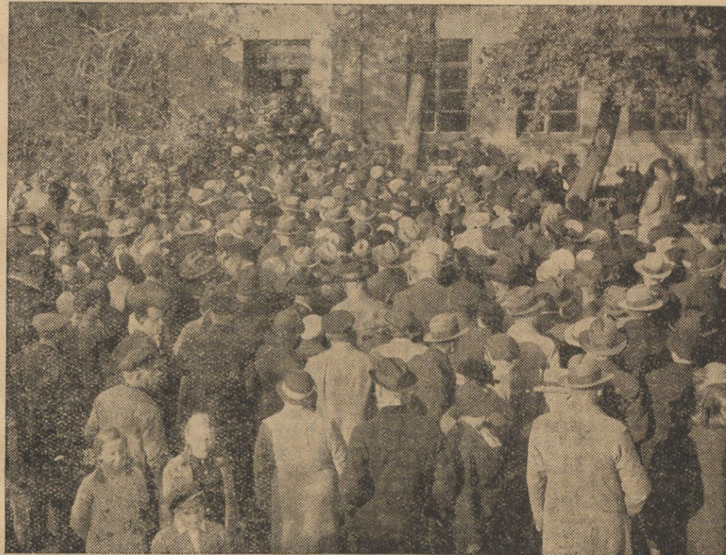
Skomplikowana procedura głosowania podczas wyborów w Kłajpedzie dla oddania głosu wymagała aż 10 minut. W związku z tem ilość lokali wyborczych z 73 podczas poprzednich wyborów została zwiększona do 200 w wyborach obecnych. W niektórych miejscowościach głosowanie odbywało się pod otwartym niebem. Na ilustracji — jeden z lokali wyborczych, szkoła w Pogięjach, gdzie wyborcy czekali do 8 godzin, zanim oddali swoje głosy.

tanji do Francji w sprawie zapewnienia współdziałania morskiego ze strony Francji na Morzu Śródziemnym w razie niesprowokowanego ataku floty włoskiej na statki brytyjskie przypuszcza się w kołach poinformowanych, że zwrócenie się to nastąpiło dlatego, że w parcie Ligi Narodów w art. 16 istnieje pewna luka, którą należy wypełnić, a mianowicie, interpretacja brytyjska polega na tem, że pakt Ligi Narodów nie przewiduje żadnych zarządzeń udzielenia pomocy przez państwa Ligi Narodów w wypadku, gdy członek Ligi Narodów zostanie zaatakowany, zanim jeszcze nastąpi określenie napastnika.