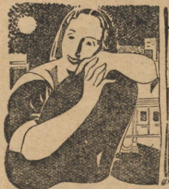
ŚLUCHOWISKO NAŁKOWSKIEJ CZWARTEK 3. X. O GODZ. 21.00