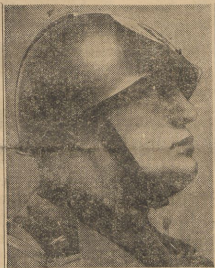
RZYM, (Pat). O godz. 18.30 Mussolini wygłosił z balkonu pałacu weneckiego wielką mowę

Na placu Littorio wywieszono chorągwie państwowe, sztandary ukazały się również na wszystkich gmachach państwowych w całym Włoszech. Tłumy przechodniów wracają do domów, aby przywdziać czarne koszule. Sklepy są zamykane. Kawiarnie pustoszeją.