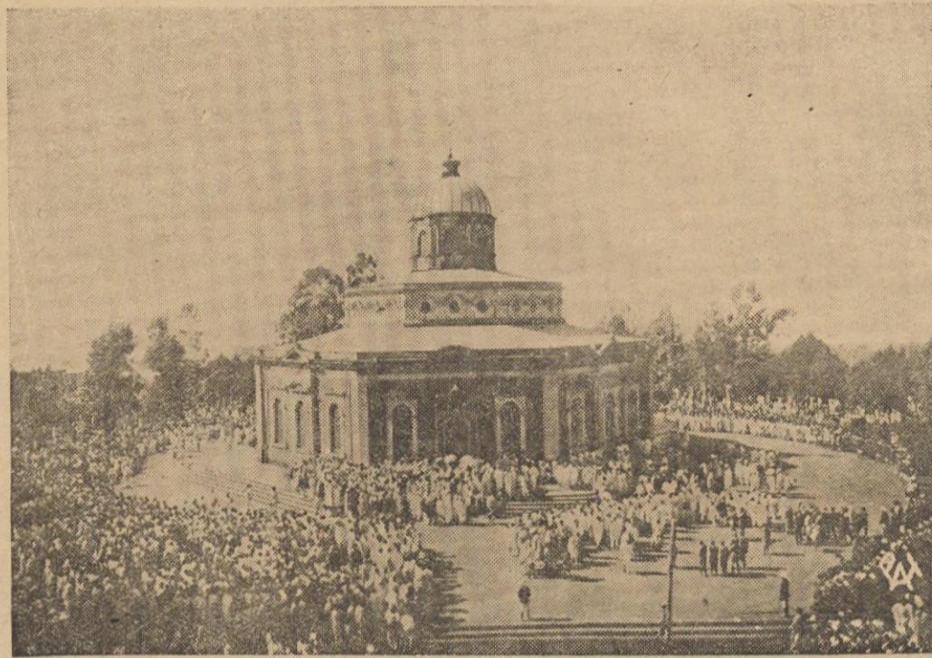
Thumy wiernych przed katedrą Św. Jerzego w Addis — Abebie podczas niedawnych uroczystości Nowego Roku.