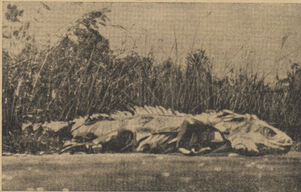
Jednemu z fotografów amerykańskich udało się dokonać zdjęcia ostawionego „potwora z Florydy“. Chodzi tu, jak widać ze zdjęcia, o niezmiernie rzadko spotykanego jedynie w Ameryce pająka, którego, za wyjątkiem owego fotografa, nikt jeszcze nie oglądał.