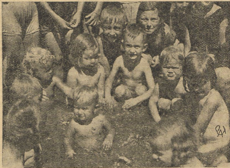
W basenie dla dzieci nowowznowionym w parku Neukölln w Berlinie.