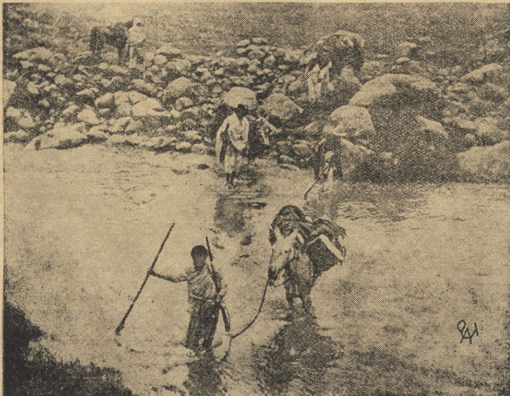
Przeprawa przez potok górski pod Harrarem.

Z odległych pustynnych i górskich miejscowości ściągają do Harraru i Addis Abeby wojownicy abisyńscy. Niosą ze sobą broń, a na mulach wiozą niemal cały dobytek. Rozkaz cesarza zabronił kobietom abisyńskim brania udziału w walce, stara tradycja jednak częściowo zostanie utrzymana — kobiety abisyńskie towarzyszyć będą mężom i braciom jako sanitariuszki.