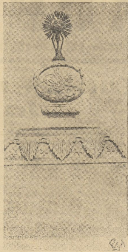
Pomnik turecki z napisem arabskim na szczycie kopca, znajdującego się opodał kopca—mauzoleum ku czci Warneńczyka. Pomnik ten postawiono na miejscu, na którym stał sułtan turecki kierując bitwą warneńską.