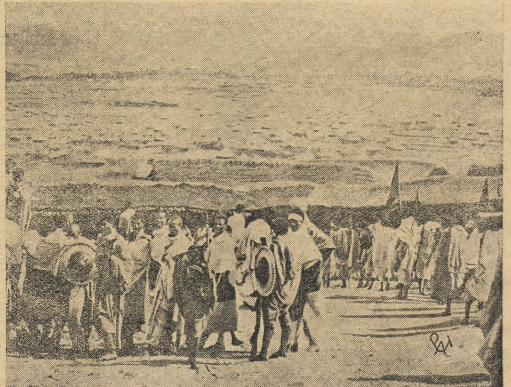
Grupa abisyńskich wojowników na podwórcach pałacu cesarskiego w Addis-Abeba.