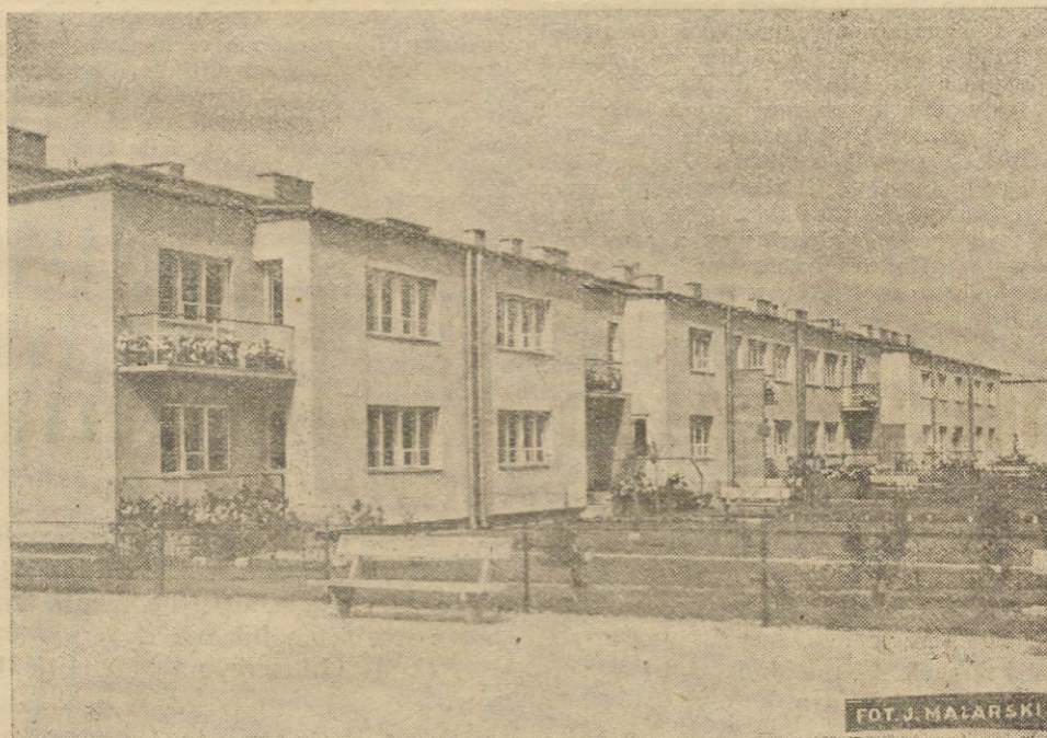
Szeregowe domy dwurodzinne, zawierający każdy 2 mieszkania dwupokojowe z kuchnią, łazienką i t. d. W każdym domu pralnia w suterenu. Cena wraz z działką, urządzeniem ogródka i ogrodzeniem zł. 36,200.

Tow. Osiedli Robotniczych (t. zw. T. O. R.) wystawia wzorowy domek dla robotników, zarabiających mniej, niż 250 zł. miesięcznie i szereg tablic, wykazujących braki dotychczasowej polityki budowlanej.