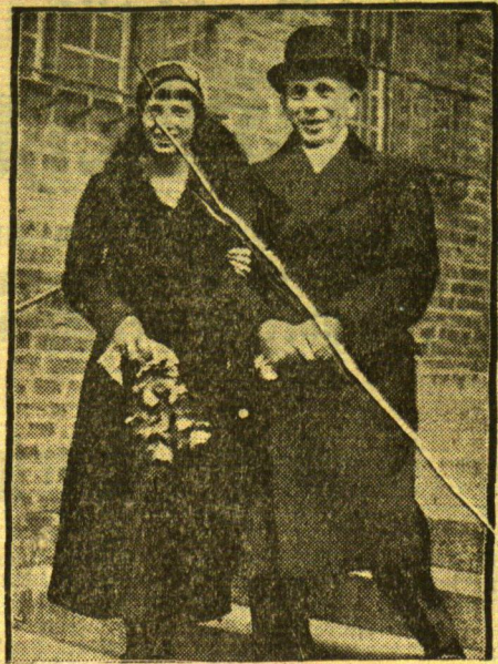
Der Start in die Ehe

Ich habe sehr erhebliche Wünsche im Interesse der Verwaltungsreform von anderer Seite gehört, die