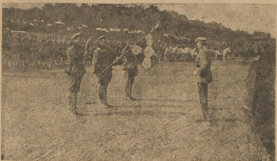
W dniach 10 i 11 lipca 14 pułk ułanów, stacjonujący w Lubelszczyźnie, obchodzi uroczystość swoje doroczne święto pułkowe. Ześwieciem tem związana jest tradycja dekoracji sztandaru pułkowego Krzyżem „Wirtuti Militari” dokonanej w r. 1921 w Tomaszowie Lubelskim przez Marszałka Józefa Piłsudskiego.