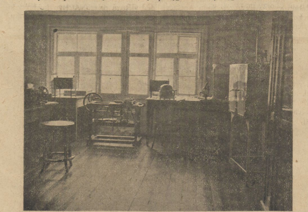
Instytut badania mózgu — pracownia

Oto ten niski szczerpy człowiek, w zwykłej szpitalnej odzieży, spaceruje na zielonej murawie, otoczonej wysoką siatką. Uśmiecha się i raduje. Jest szczęśliwy. W zachowaniu jego nie dostrzeż nic, co wskazywałoby na obłąkańca. Gdy