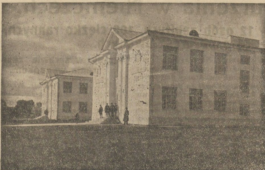
Szkoły Powstalców Nr. 1 i Nr. 2 im. Przewoźnika G. Narutowicza w Lidzie.

DEWIZY: Nowy York 8,923 — 8,903. Paryż 34,98 — 35,52 — 34,89. Szwajcarja 174,00 — 174,43 — 173,57. Berlin w obr. nieof. 211,90. Tendencja niejednolita. PAPIERY PROC.: 3 proc. pożyczka budowl. 36, 4 proc. inwestycyjna 94, 4 proc. inw. serjyna 98,75, 5 proc. konw. 36, 4 proc. dolarowa 47,75, 7 proc. stabilizacyjna 47 — 47,38 — 46,88, 8 proc. LŻ. BGK. i BR. obl. BGK. 94. Te same 7 proc. — 83,25, 4 i pół proc. ziemskie 34,75. Tendencja niejednolita. Akcje: Bank Polski 72,50.