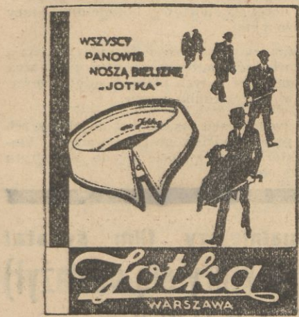
Do nabycia w pierwszorzędnym magazynie galanterijnych.