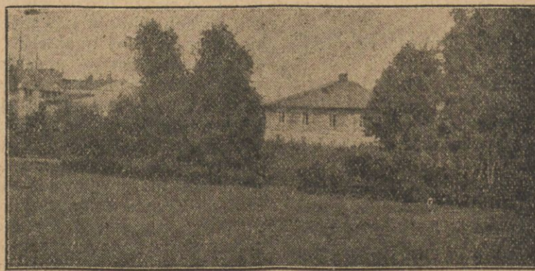
Fragment Zulowa, miejsca urodzenia Marszałka Piłsudskiego.