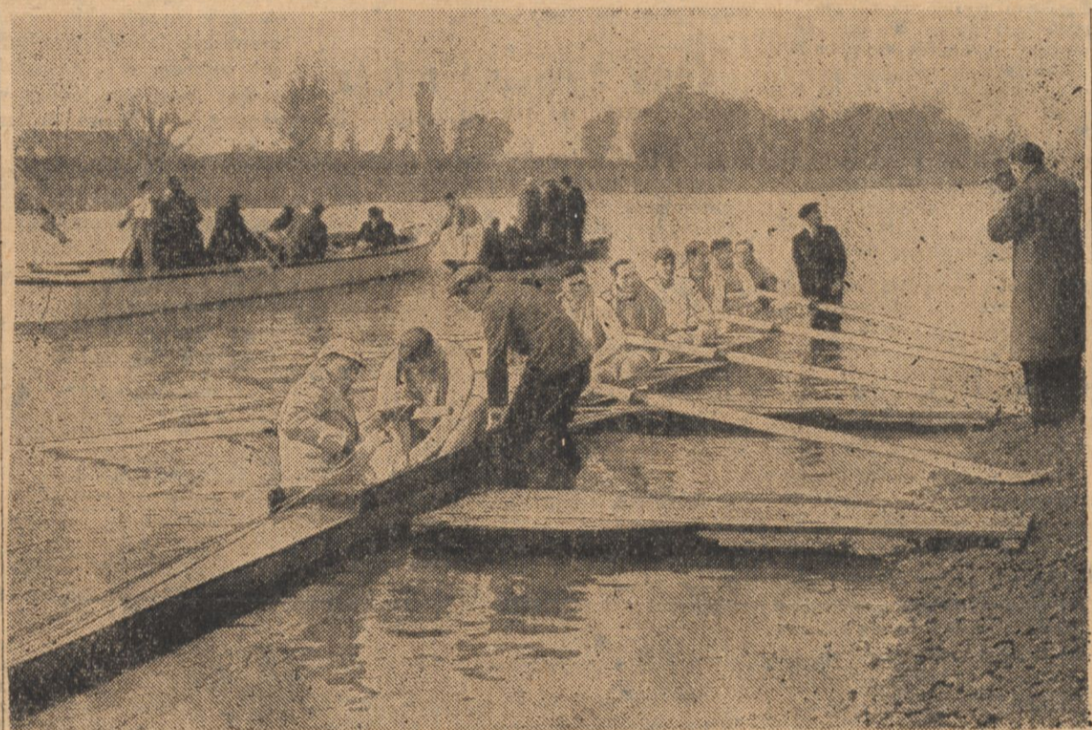
24 marca odbędzie się w Anglii doroczny emocjonujący wyścig wioślarski pomiędzy osadami Oxfordu i Cambridge'u. Na zdjęciu osada Cambridge'u podczas treningu.