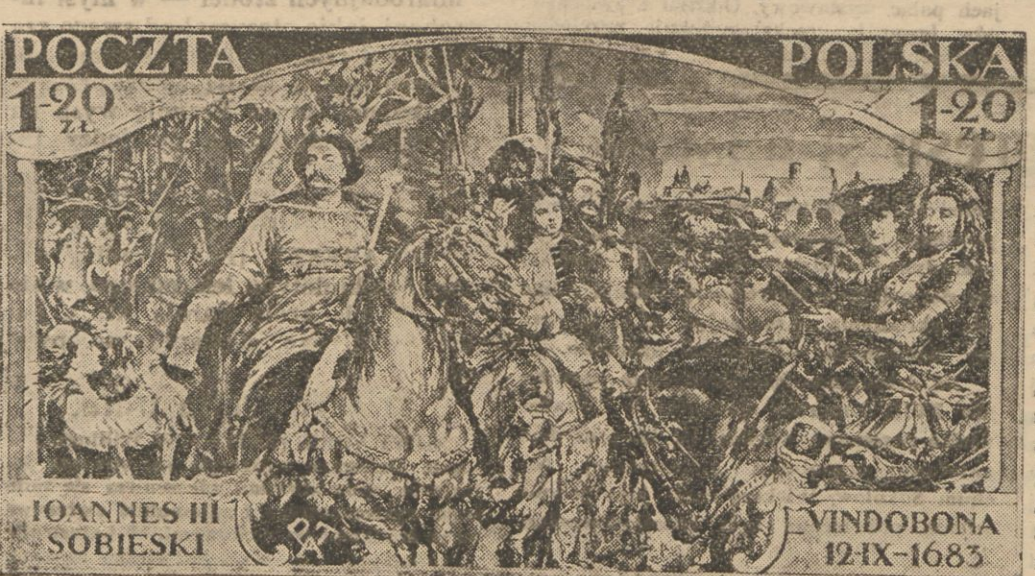
Nowy polski znaczek pocztowy, wydany ku czci króla Jana Sobieskiego z okazji 250 rocznicy odsieczy Wiednia. Rysunek przedstawia fragment obrazu Jana Matejki „Odsiecz Wiednia” z główną postacią króla Jana Sobieskiego na pierwszym planie. — Znaczek tęczowy jest w kolorze ciemnoniebieskim z odcieniem fioletowym. W sprzedaży ukazuje się po raz pierwszy w dniu obchodu rocznicy t. j. 12 września b. r.