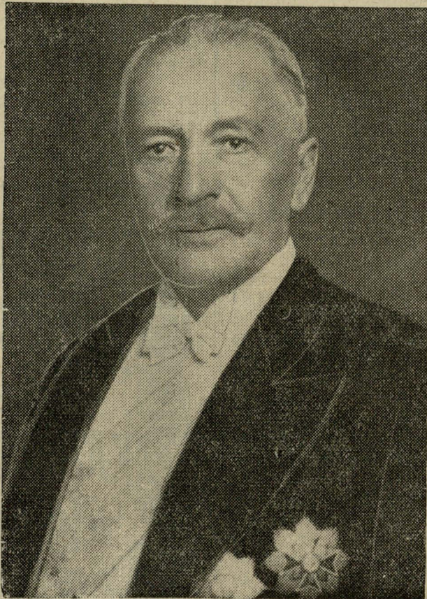
Prezydent Prof. I. Maścicki

11.XI minula roŭna 20 hadoŭ, jak Maršalak J. Piłsudski viarnuŭsia z Magdenburskaj krepašci, ty dzień jość polskim dziaržaŭnym šwiatam. Voš-ža 11 listapada sioleta adbyłasia ŭva ūsiej Rečy-