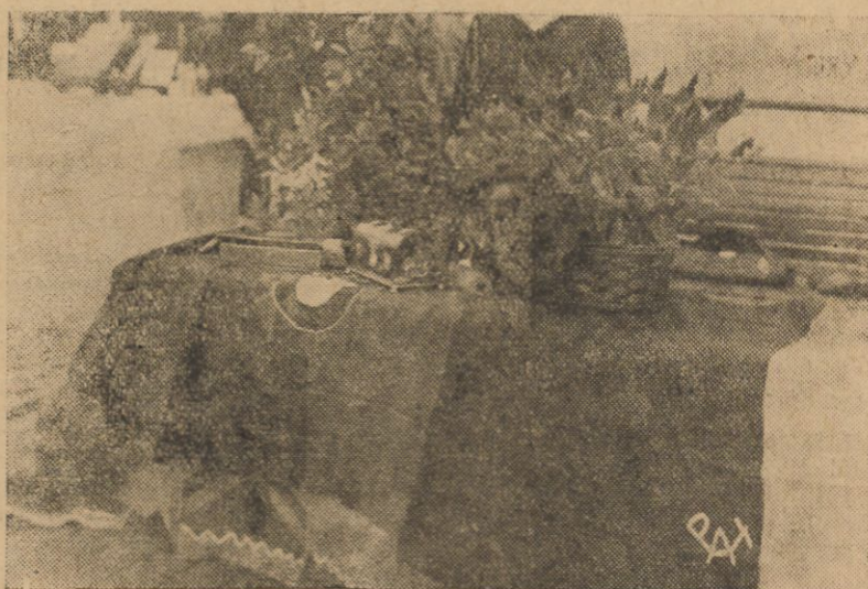
Przywieziona na M/S „Piłsudskim” szkatuła, zawierająca ziemię z Madery i historycznych pobożowisk przeznaczona na Kopiec Józefa Piłsudskiego na Sowińcu.

w okresie świąt Bożego Narodzenia — opłatek dla członków i choinkę dla biedniejszych dzieci ze wsi, 22 stycznia — obchód powstania Styczniowego, 1 lutego — imieniny Pana Prezydenta Mościckiego, 19 marca — dzień imienia Pierwszego Komendanta (jeśli inne zarządzenia nie zostaną wydane), w okresie świąt Wielkanocnych — święcone, 12 maja — dzień śmierci Pierwszego Komendanta i Pierwszego aMarszałka Polski, 6 sierpnia — święto organizacyjne. Wszystkim obchodom nadać należy inny niż dotychczas charakter. Każdy obchód, przypominający zawsze jakiś czyn, dzieło lub pracę — czynem na szym musi być uczczony. W dniu takich rocznic zdobyć się musi każdy nasz pododdział na jakąś pracę dla dobra środowiska i państwa. Chodzić tu będzie o pracę taką, na jaką stać daną jednostkę, jaka w danych warunkach jest pożądana.