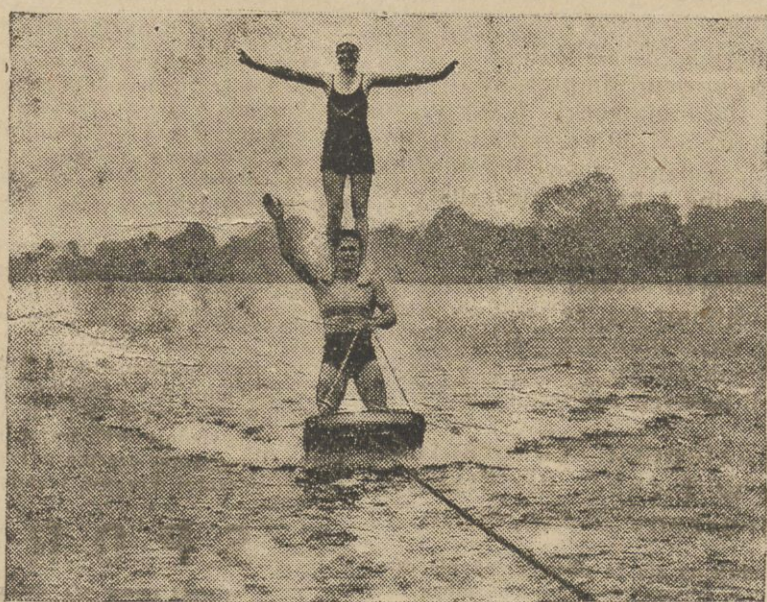
Emocjonującym sportem wodnym, niezwykle popularnym na zachodzie są łak zwane narty wodne, zwane także aquaplanami. Choć nie jest to rzeczą łatwą utrzymać się

na desce ciągnionej po falach przez motorówkę, nie zdaje się to sprawaz: większej trudności zreczym sportowcom angielskim, których widzimy na naszej fotografii.