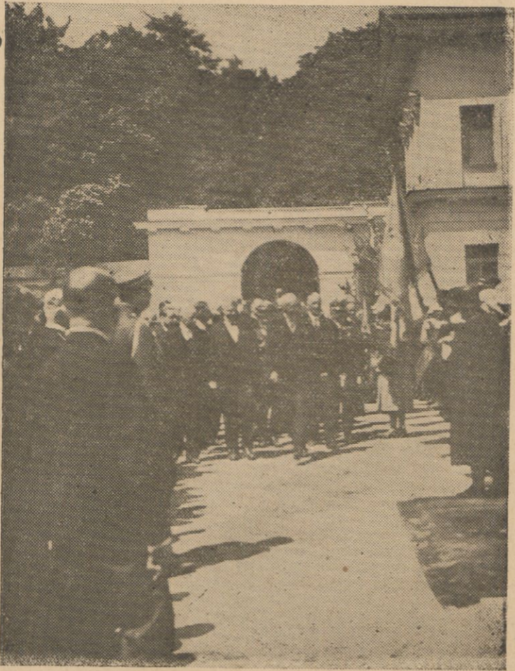
Owajcynie powitania P. Prezydenta przed dziećmi szkół powszechnych.

Nadzwyczaj gorąco i serdecznie odniosły się do odwiedzin Pana Prezydenta Mościckiego tujejsze tak liczne warstwy ludności rzemieślniczej. Z Izby Handlowo-Przemysłowej udał się Pan Prezydent Rzeczypospolitej na uroczyste posiedzenie Wileńskiej Izby Rzemieślniczej. Wzdłuż całej ulicy Niemieckiej, gdzie mieści się siedziba Izby ustawili się szpalierami po obu stronach