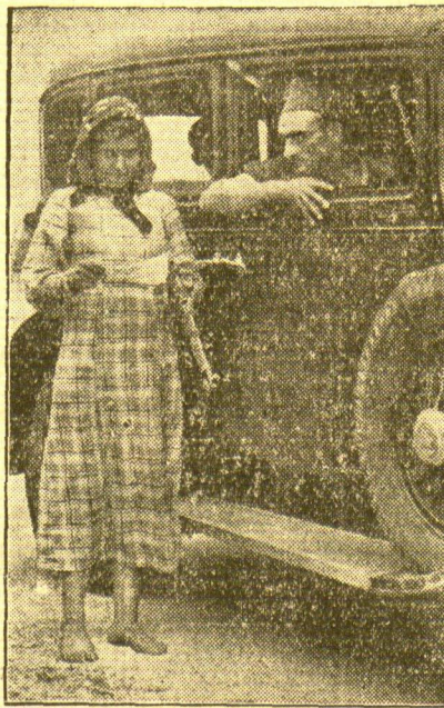
Ein Bild aus der Kampagne westlich von Madrid

Die nationalen Truppen befinden sich auf dem Vormarsch nach Madrid. Die Truppenteile setzen sich zum Teil aus Fremdenlegionen und Marokkanern zusammen, die unser Bild bei dem Durchzug durch Burgos, dem Sitz der nationalen Regierung, zeigt