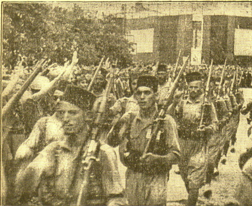
Die nationalen Truppen in Burgos

Die nationalen Truppen befinden sich auf dem Vormarsch nach Madrid. Die Truppenteile setzen sich zum Teil aus Fremdenlegionen und Marokkanern zusammen, die unser Bild bei dem Durchzug durch Burgos, dem Sitz der nationalen Regierung, zeigt