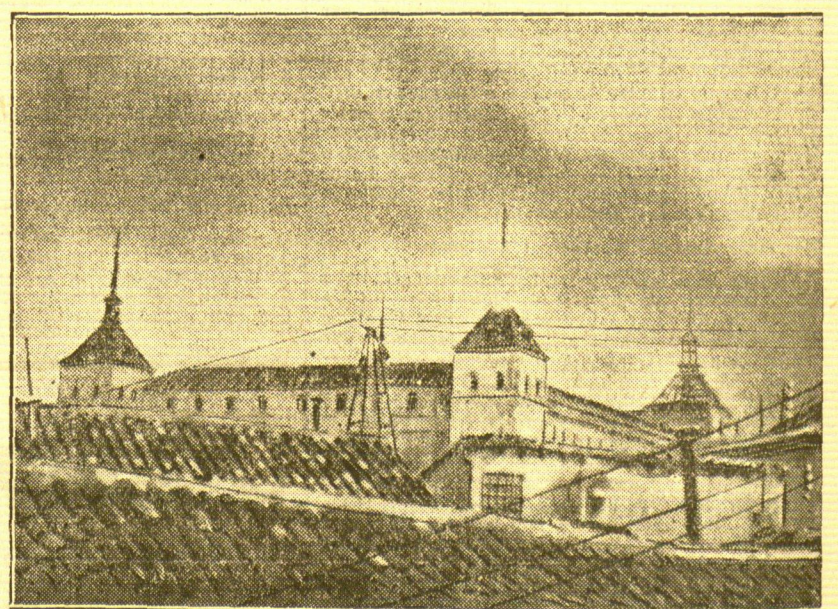
Der Alcazar in Toledo in Brand geschossen

Diese Marzistin überprüft mit dem Gewehr im Arm den Passierchein eines Autofahrers auf der Landstraße von Navalmoral