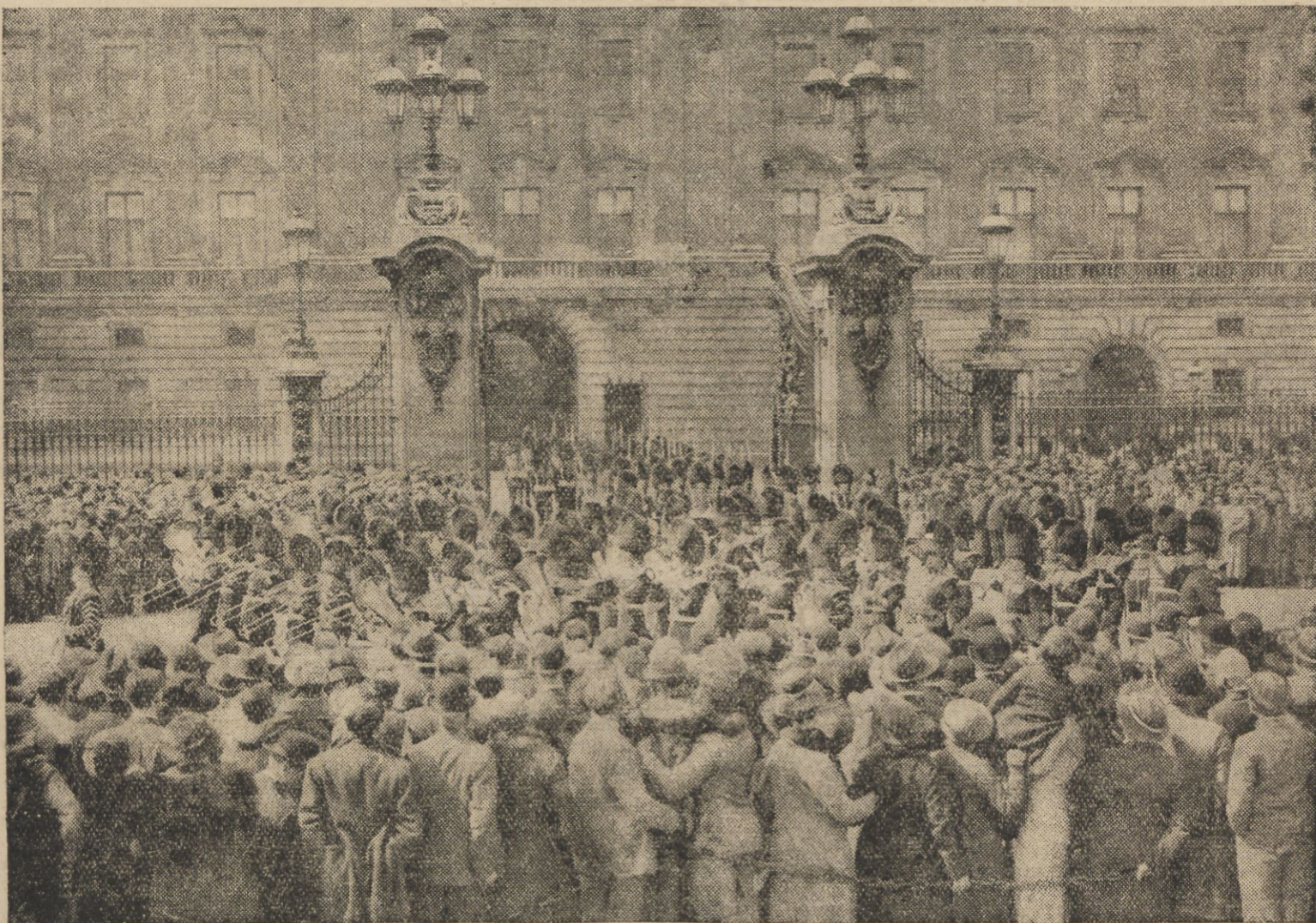
Na uroczystości jubileuszowe do Londynu przyjechały miliony gości z różnych zakątków świata. Ilustracja przedstawia tłumy przed Buckingham-Palast podczas zmiany warty pałacowej.

Ale i ta nie ma wielkiego zrozumienia czy uznania ze strony ciemnych rodziców, którzy dziecko własne uważają za siłę roboczą w gospodarskim obejściu. A tacy są prawie wszyscy nasi chłopci. Ciemnota i nędza — zagłuszyły w nich człowieczeństwo. Chłop wieprzaka wyżej ceni niż rodzone swe dziecko. Jest ono zawsze bite — zakrzywane, zahukane, zapopychane. Zaniedbane — głodne, bose, nagie — od urodzenia nie kapane. Najwcześniej ono wstaje (pasie o świcie krowy, póki niema bąków), najpóźniej się kładzie (skrobie kartofle na jutro) — i za to wszystko dostaje najgorszą porcję strawy, która pozostaje z obiadu uprzywilejowanych dorosłych, wydajniej pracujących niż ono: wąż, małe, bezsilne dziecko... Gdy po powrocie ze szkoły zacnie odrabiać w domu lekcje — oj ciec arbitralnie każe mu narabować drewna, matka — przynieść wody, starsza siostra — zamieść izbę etc. Spycha się je z kafełkami ze stołu, bo na nim starsze wykonują jakąś „ważniejszą niż pisanie“ robotę. Odbiera się dziecku lampę, bo „kapciłka“ potrzebna jest matce tuż przy kądzieli, aby nie szła równo. Prostu dziecko nie może uczyć się na wsi — w dzisiejszym jej stanie — w dzisiejszych warunkach. A my chcemy, aby ono opanowało cały program szkolny. Nie ludźmy się — nie ulegajmy fikcji! Takie cuda jeszcze nie dzieją się na świecie.