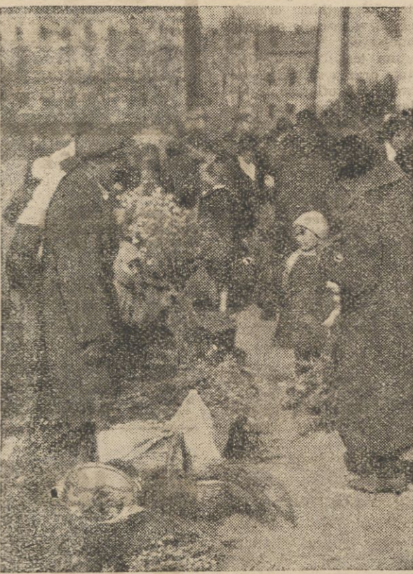
Na zdjęciu naszym widzimy sprzedaż święconych „palm” pod kościołem Św. Krzyża w Warszawie.