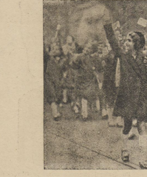
W dniu 8 b. m. obchodzono w całej Jugosławii święto dziecka. Na zdjęciu naszym widzimy pochód dwiaty szkolnej, przechodzącej przed pałacem królewskim w Białogrodzie i składającej hołd rodzinie królewskiej.