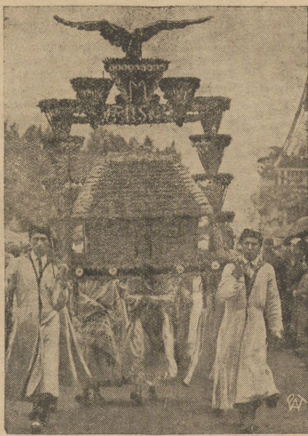
Delegacja wieńcowa z Krosna niesie dary zniwne Dostojnemu Gospodarzowi, Panu Prezydentowi Rzeczypospolitej.