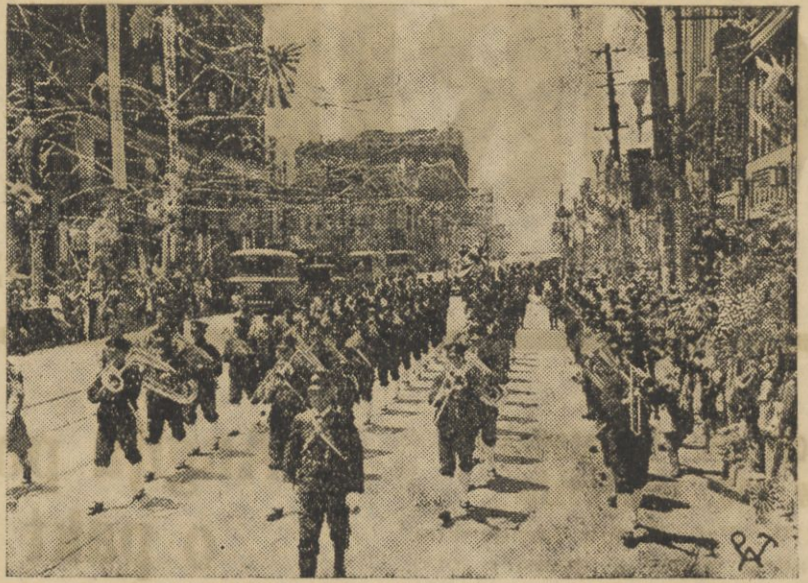
W 30-tą rocznicę sławnej bitwy pod Cuszimą, w której została rozgromiona flota rosyjska, a która zadecydowała o klęsce Rosji podczas wojny rosyjsko-japońskiej w 1905 r., cała Japonia przybrała odświętny wygląd. Dzień ten obchodzony był jako święto narodowe. — Na zdjęciu oddział 600 lotników ze Szkoły Morskiej w Yokosuka z orkiestrą, defilujący ulicami Tokio w rocznicę bitwy pod Cuszimą.