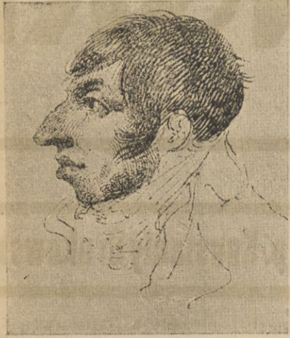
Autoportret Rustema, rysunek piórkim w zbiorach Biblioteki Wróblewskich.

urodz. w r. 1762 — zm. dn. 21 czerwca 1835 r.