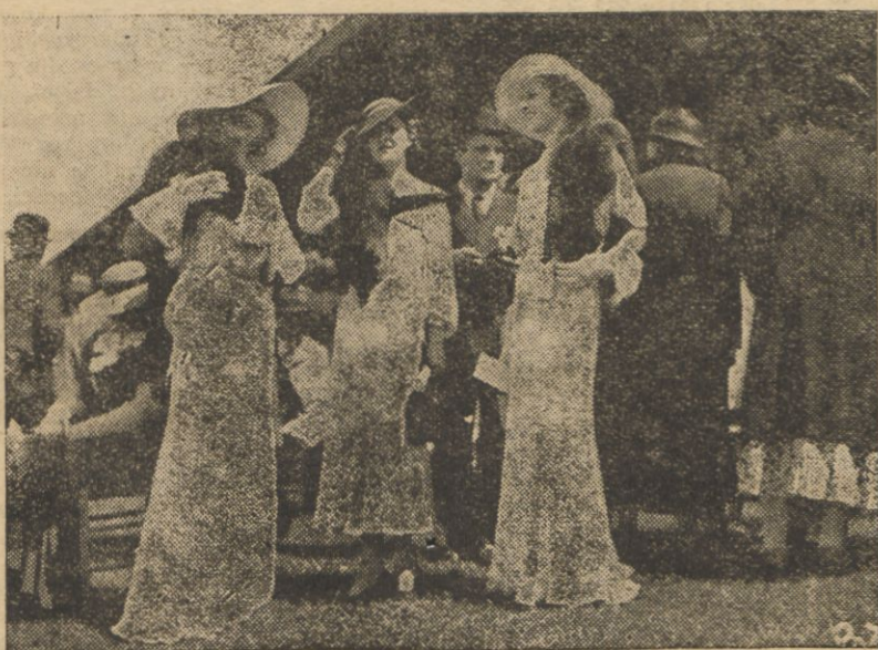
Letnie kreacje demonstrowane na wyścigach w Chantilly.

— Ale rozentuzjasmowana publiczność przekrzyknęła go, Kiepura śpiewał.