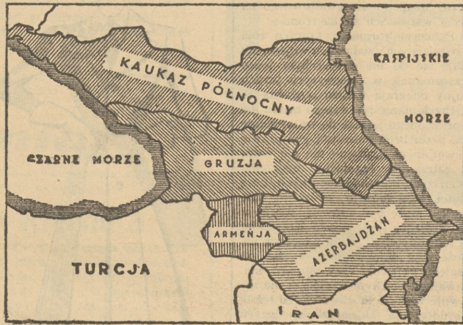
Mapa Republiki kaukaskich w granicach narodowych.

Nafta! Słowo drobne, potoczne, wchodzące w zakres zagadnień kuchennych! Ilek jednak nabrało obecnie treści i znaczenia.