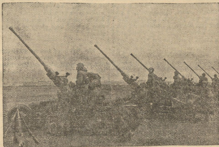
Bateria artylerii przeciwlotniczej gotowa do występu.