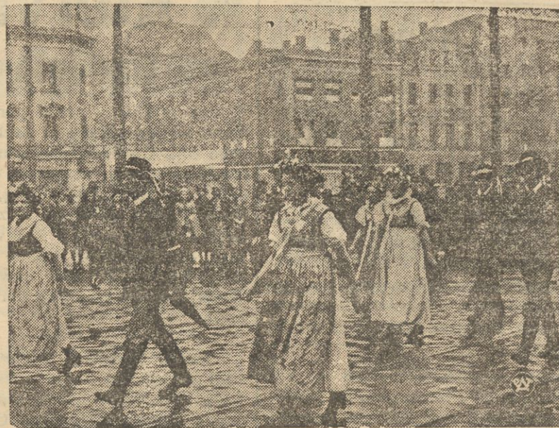
Ślązaczki w strojach regionalnych w pochodzie przez miasto, podczas wielkiej manifestacji metalowców.