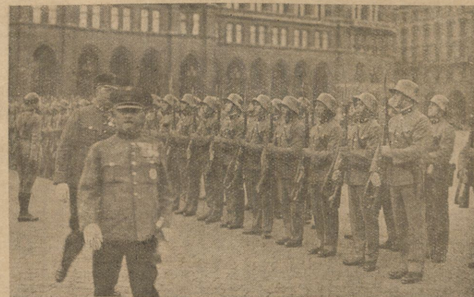
Formacje piechoty na dziedzińcu Burgu.

Na miejscu spotkania wystawiono potem pomnik. Skromny biały obelisk, niewysoki i jaski wąpli, a na nim umieszczono tabliczkę z napisem: „An dieser Stelle beglückwünschten sich Kaiser Leopold I und König Johann