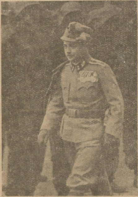
Bundeskanzler Dr. E. Dollfuss przed frontem 4-go pułku piechoty.

tymentalny, a głos trąbki — didi-rum-didi-bum — wydaje się nawet śmieszny. Sentymentalizm krąży widocznie od wieków we krwi Wiedeńczyków. Lepszy jest zresztą naturalny sentymentalizm od wymuszonego namuszenia, od obstalunkowej powagi i nastrojania się na górne tony. Gdy się utrzymuje sztucznie na zbyt wysokim poziomie, następuje potem ostra reakcja, której efekt może być komizny albo bolesny.