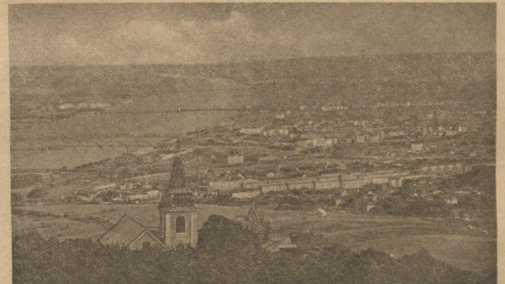
Widok ze szczytu Kahlenbergu na Wiedeń.