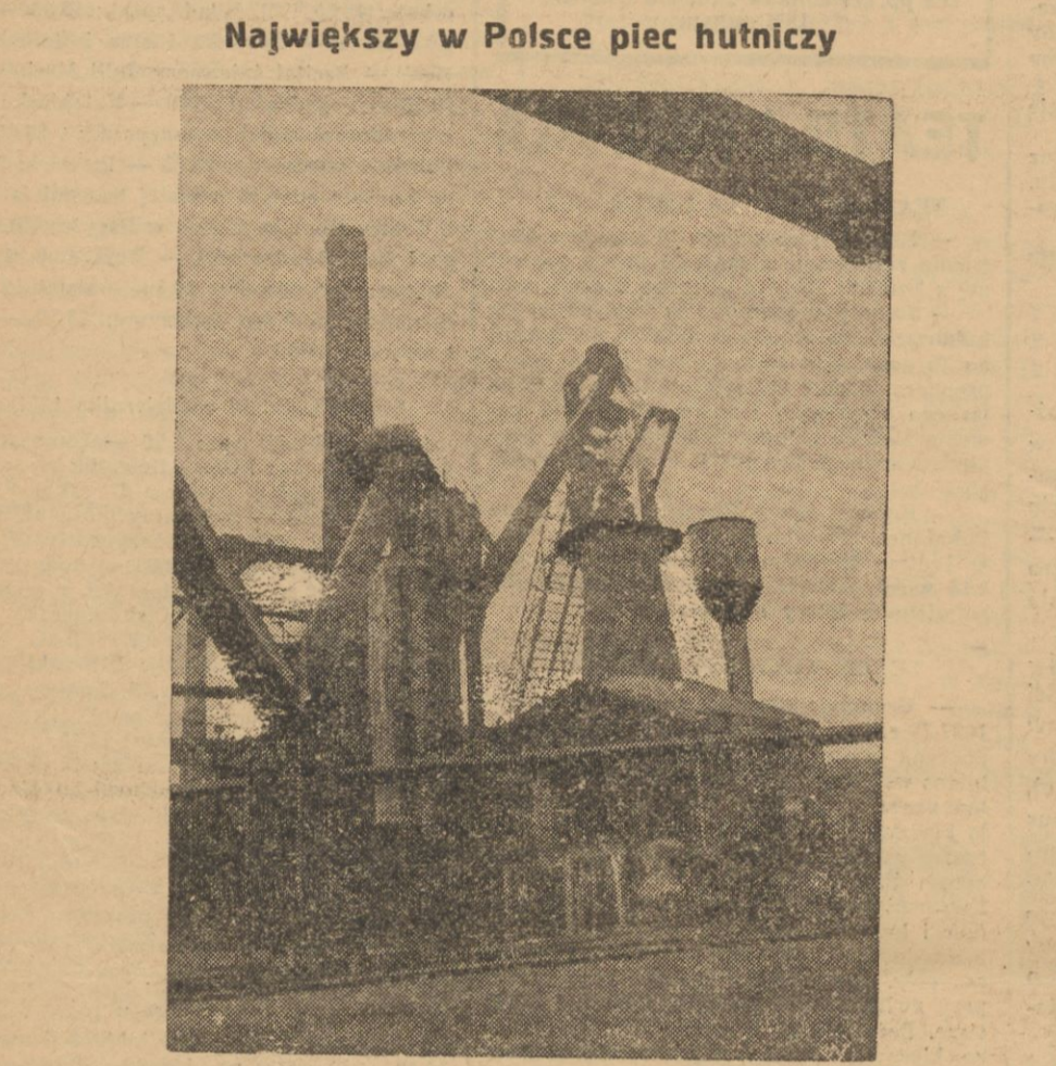
Na zdjęciu nowowynbudowany wielki piec w hucie „Piłsudski“ w Chorzowie, największy w Polsce pod względem wydajności, którego zapalenie odbyło się w tych dniach przy udziale zespołów robotniczych huty.