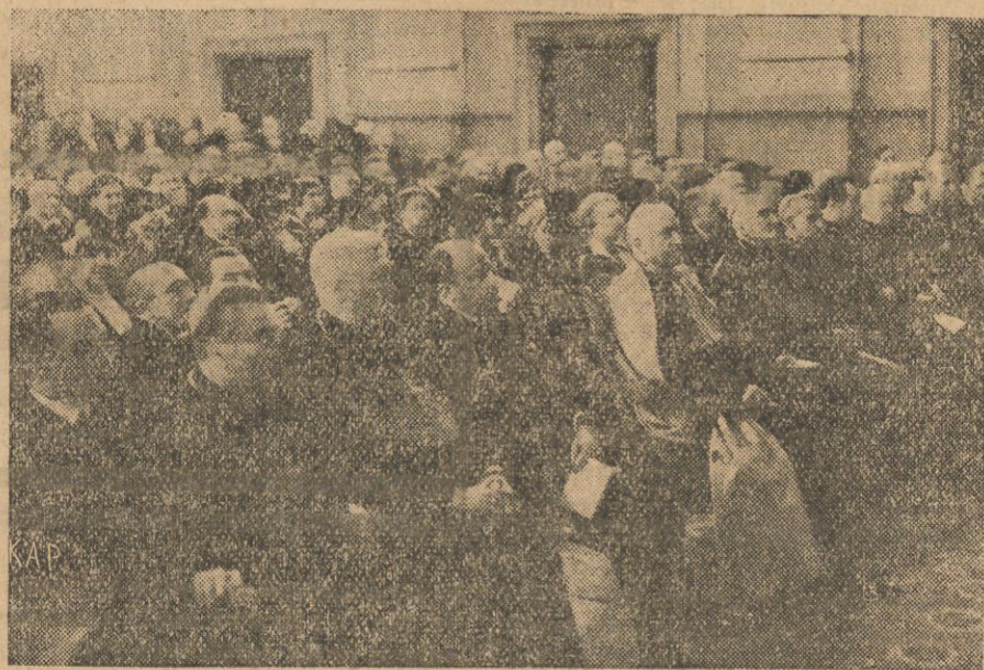
W związku ze wznowioną akcją, zmierzającą do wszczęcia procesu beatyfikacyjnego Królowej Jadwigi, odbyły się w Krakowie dnia 9 bm. uroczystości ku Jej czci z inicjatywą J. E. ks. Metr. Sapiehy, zakończoną akademią w Sali Domu Katolickiego.