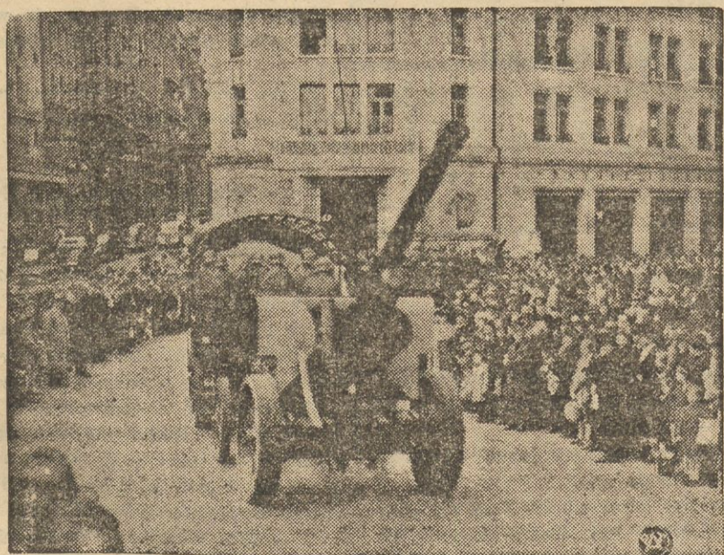
Zmotoryzowane działo przeciwlotnicze na ulicach Łozanny.