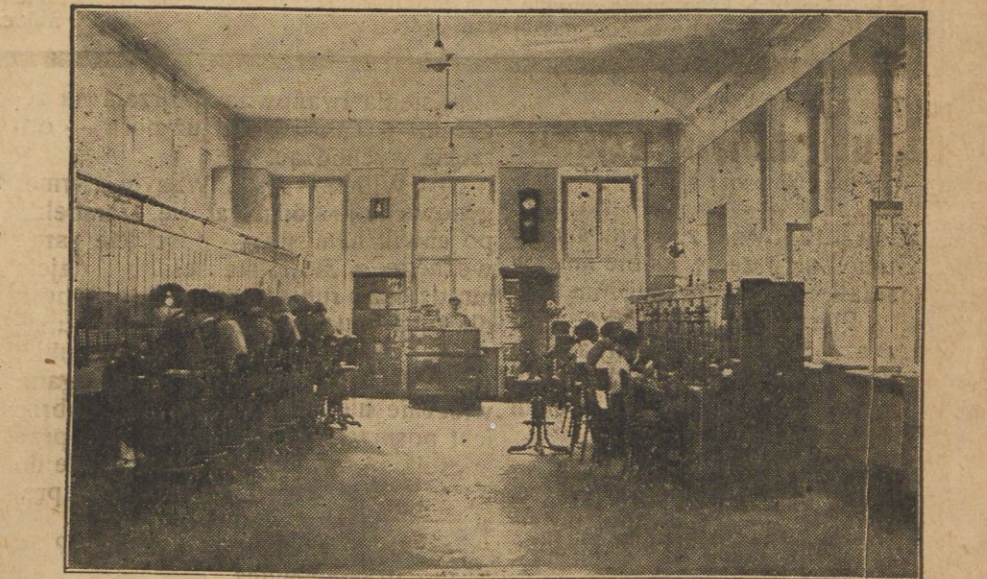
Sala główna Wil. Centrali Telefon.

To kable. W jednym z nich kilkaset par drucików, z których każda należy do pojedynczego abonenta. A kablów tych kilka. W następnej komorze 2 dynamo, na której drzwiach trupa głowa i zapowiedź, że zapalenie ognia grozi śmiercią. Wchodzimy. 2 jakby baseny szklane, coś w rodzaju dużych akwarjów. To akumulatory. Jeden zawsze naladowany, drugi naladujący się elektrycznością. Stąd energję czerpie centrala, posługując się niemi dlatego, że równomiernie od dynamo zasila ją w prad. Akumulatory — to jakby spiżarnia centrali. Niema w niej smakołyków, ale jest coś, bez czego nie po telefonie. Na parterze w dużej sali właściwa cen-