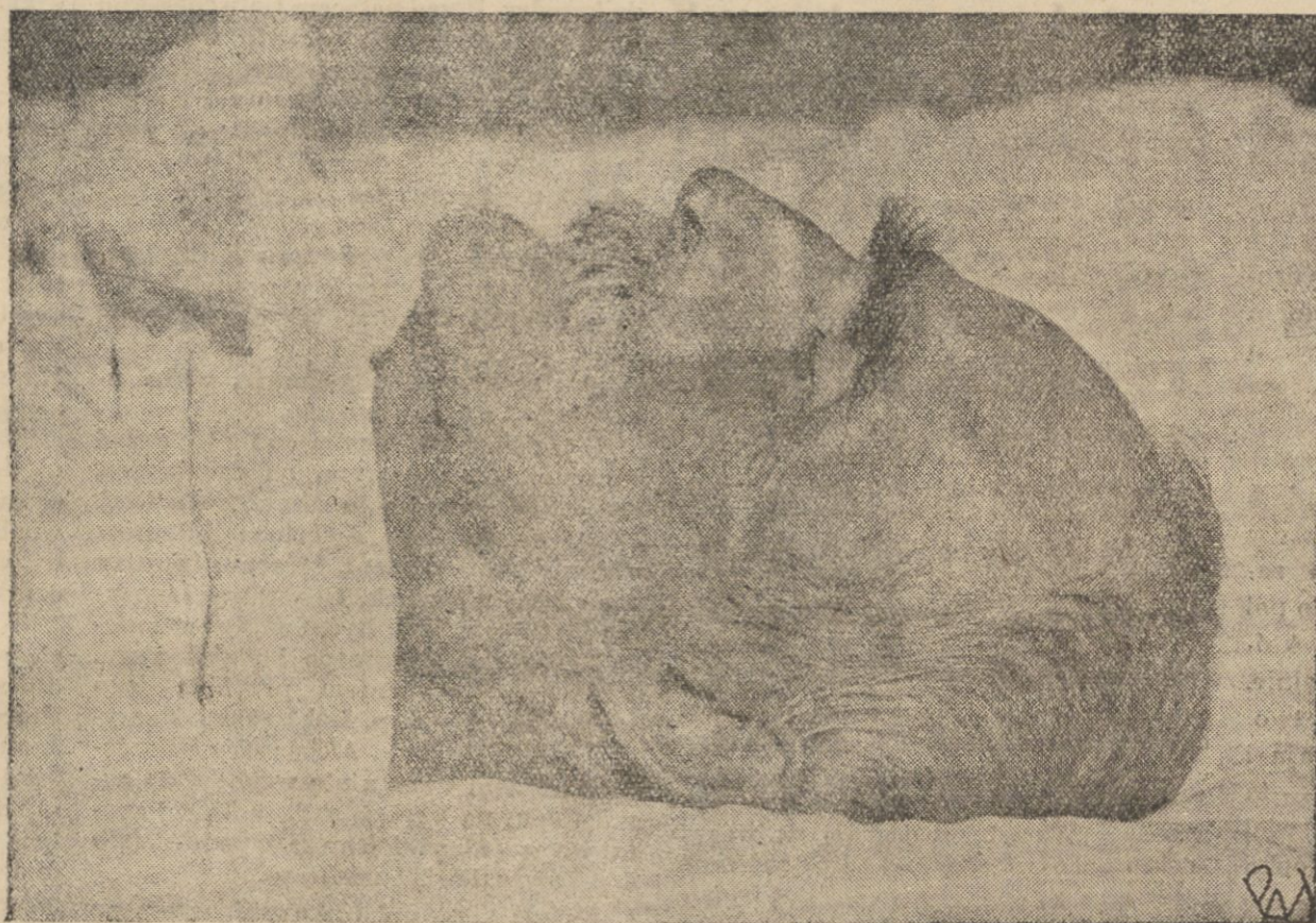
Zdjęcie dokonane w godzinę po zgonie.