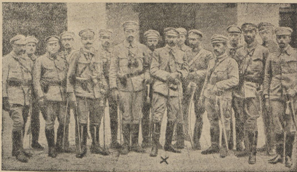
Rok 1914. Komendant Piłsudski w gronie oficerów Legionowych.

Łotwa i Polska! Jakże ściśle związane są ze sobą losy obu państw, jakże podobne dzieje obu narodów w latach ostatnich! Wspólna niewola rosyjska, ten sam ucisk okupanta niemieckiego, te same łuny pożarów na horyzoncie i to samo zniszczenie wojenne, jednoczesne niemal wyzwolenie i wspólne — ramię przy ramieniu — walki o utrzymanie niepodległości! A nic przecież tak nie łączy ludzi ze sobą, jak braterstwo wspólnie przelanej krwi.