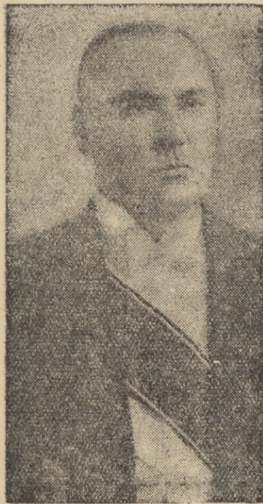
KWIESIS Prezydent Łotwy.

Bezstronny obserwator mógł stwierdzić że sejmowładztwo łotewskie stanowiło odstraszący przykład nieudolnego zastosowania zasad demokracji w rządzeniu państwa. Niezliczo na ilość grup, grupki, koteryj i klik pro wadziła ze sobą targi, robiąc nawzajem propozycje, wymagając dla siebie koncepcyj... Interes państwa, interes narodu cierpiał na tem. W chwili, kiedy sytuacja groziła podstawom istnienia państwa, nastąpił przewrót. Premier Ulmanis, mający już piękną kartę w dziejach młodej państwowości łotewskiej, wysunął hasło zjednoczenia narodu.