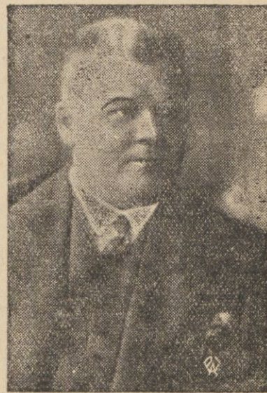
ULMANIS Premier i Minister Spraw Zagranicznych Łotwy.

Rząd, przez niego stworzony, przeprowadził szereg zasadniczych reform. Kryzys rolnictwa dawał się w Łotwie odczuwać bardzo silnie. Ulmanis wstrzymał licytacje zagród włościańskich, co groziło ruiną dziesiątkom tysięcy pracowników roli, (w r. 1933 wystawiono na licytację 4.300 gospodarstw wiejskich) wydając jednocześnie szereg ustaw, ułatwiających rolnikom wywiązanie się ze zobowiązań pieniężnych. Wprowadził w życie rodzaj monopolu zbożowego, rząd zagwarantował umieszczenie na rynku po cenach wyższych, niż giełdowe około 300.000 tonn żyta. Stosując system