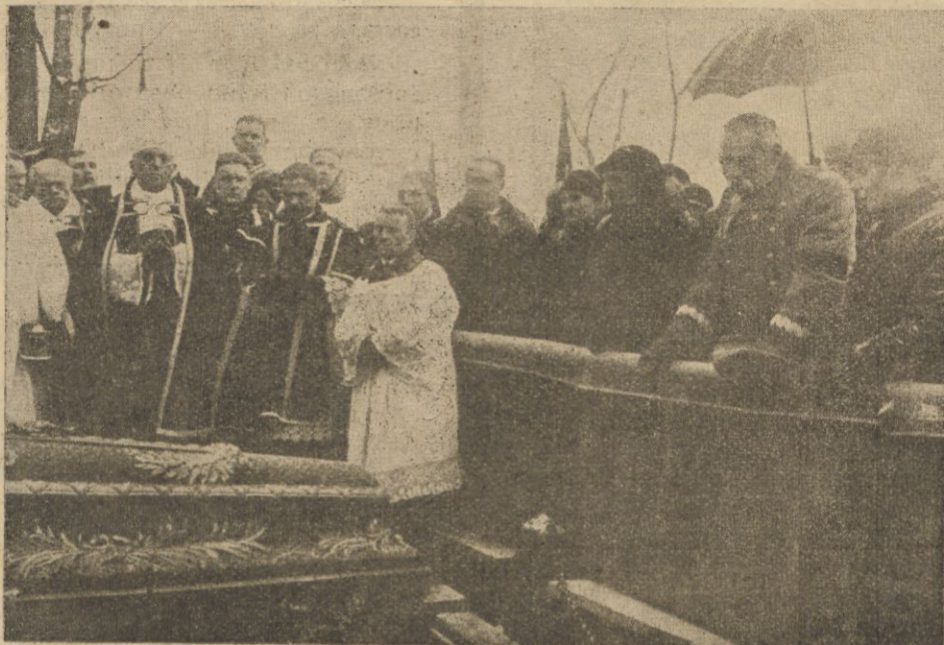
Nad otwartą mogiłą. (Do art. na str. 2-ej).

Złożenie zwłok ś. p. Zofji Kadenacowej na wleczny spoczynek