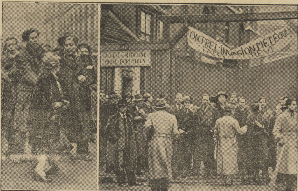
Manifestacje studentów w Paryżu przeciwko studentom-cudzoziemcom.