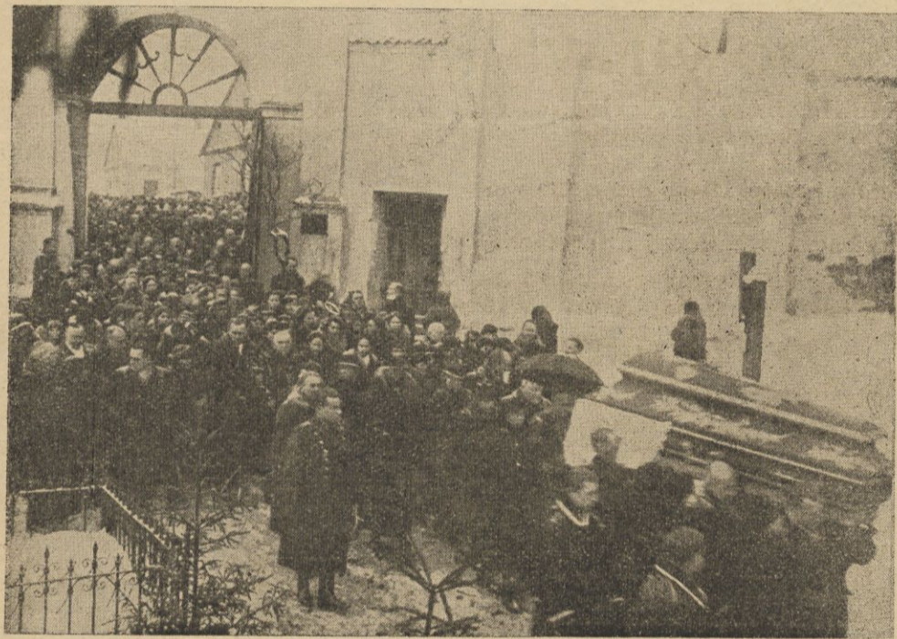
Pochód żałobny w bramie cmentarza Bernardyńskiego.

kosztowało stenografowanie i utrwalenie w druku zeznań świadków, 32.000 dolarów wyniosły koszty utrzymania wszystkich osób biorących udział w procesie, sumy 180.000 dolarów dosięgły honoraria reporterów, fotografów, rysowników i publicystów, zdających relacje z procesu, potężną sumę 600.000 dolarów pochłonęły koszty instalacji licznych kabli telefonicznych i telegraficznych, oraz transport sprawozdań i zdjęć z procesu zapomocą autokarów i samolotów, 30.000 dolarów wyniosł rachunek Brodeastingu za transmisje radiowe przewodu sądowego, wreszcie 100.000 dolarów wyniosły koszty śledztwa prowadzonego z polecenia prokuratury.