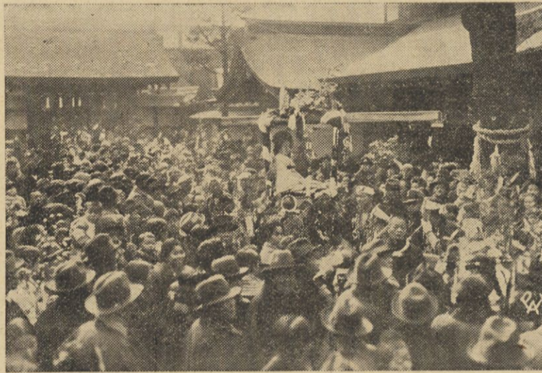
Fragment pochodu w dniu tegorocznego tradycyjnego święta gejsz w Tokio.