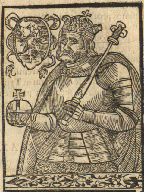
Miesco dca generatur

Tentonibus tantum equa suis: quam credis ab illa Tractata est miseris terra Polona modis? Tunc Boleslai nobis periere labores, Ruperunt nostrum Regna subacta iugum. Ut rapuit tantum mors fausta phrenitide Regem, Pellitur è Regno, Rixa fugitq; suo. Dant pœnas scelerũ: furor huc, dolor abstulit illã At longo fato dignus vterq; fuit.