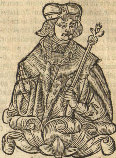
Virtus Sē- moniti.

Sic & Alexander iuuenis vix illa suarum Ingressus rerum limina magna. perijt: Vt SEMOVI TE peris. patriaq; relinquis acerbos Mærores, iustam mortuus ante diem. Ense tuo eiecti de nostro turpiter agro Vltra Carpathium, Pannones vsq; iugum. Tota tibi soluit Pomerania victa tributum. Fluctibus & nostris accola quisquis erat. Quatuor annorum sunt, hæc omnia, quid si Non abrupta tibi tam citò vita foret? Quamuis, quantumuis modica sub tẽpore vita Maxima qui gessit, vixit abundè diu.