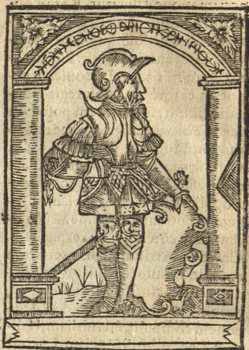
Vladislaus Silesiam vastat.

C orpore parvus eram, subito vix altior vno: Sed tamen in paruo corpore magnus eram. Non ego Prussorumq;, Bohemorumq;, cruorens Iactabo, cladem nec Gedimine tuam: Fortunam vici, cum qua mihi bella fuerunt, Vt niger è terris triste volarat iter. Ter cecidi Regno: per te Ramnusia semper, Post lapsum erexi maius ad arma caput. Corde vir is opus est magno, non corpore: magnum Qui strauit Goliath, nonnè pusillus erat? Ingentem paruus Poliphæmum vicit Vlysses. Sed tamen ille hominem: tam graue numen ego?