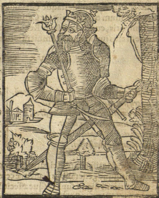
Cum Conrado Imperatore & Friderico Barbarossa belligeratur.

A Nno Domini 1146. Boleslaus Crispus, à capillis contortis dictus, fratre Vladislao seditioso expulso, habenas regni suscepit. A Cōrado Imperatore frequenter sollicitabatur, vt aliquam regionem exulanti fratri concederet, quod ille strenuè repugnabat. qua de causâ Imperator in Silesiâ exercitum duxit: sed pluribus damnis à Polonis affectus, re infecta discessit. Eadem de causa cum Friderico Barbarossa Imperatore Boleslaus bella gessit. Inimicitijsque vtrinque compositis, Vladislavum fratrem ex Germaniâ reuocatum, in gratiam accepit: qui postquam aduenit, in Ploczko ciuitate non sine veneni suspitione spiritum exhalauit. Tandem anno Domini 1164. Rex cum fratribus triplici exercitu instructus, in Prussiam descendit, quam ferro & igne latè peruastauit, ad Christianismum Prutenos sollicitans,