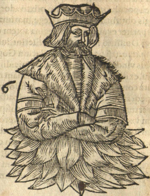
Scelus traxit latio.

A Nne tibi lectum tantum, lasciuæ, reliquit, Non etiam clypeos, armag, dura pater? Et Veneri tantum insit seruire: Gradino Non etiam, ô nosfer Sardanapale, suo? Quandoquidē in fratrum tam multa gente tuorum, Legitima solus coniuge natus eras. Successisse etiam patris te laudibus æquum Non tantum virtus, imperioq, fuit. At genitore tuo felicior, ipse fuisti Hac in tam rari parte POPELE boni: Quod tibi tu similem genuisti: quiq, putares A cuculo cuculum degenerare nefas.