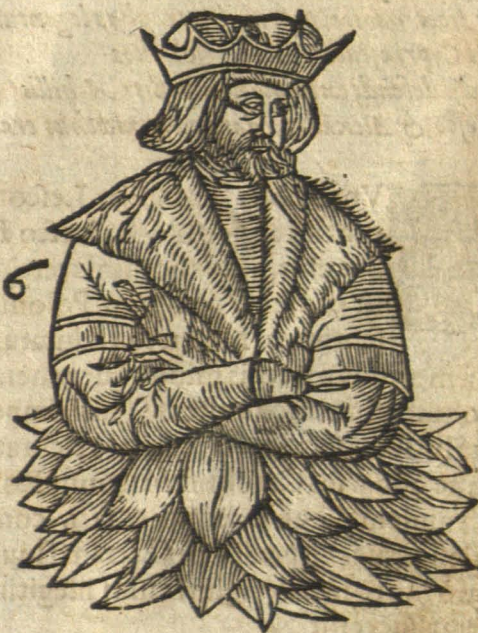
Modus electioni certata equit.

Attulit huic Regnū variorū cursus equorum, Et præter morem, Sors oculata suum, Dignus erat Regno, quamuis patre natus agresti Rusticus, & modici iustus arator agri. Non bello quàm pace minor: mireris in illo Hoc, qui nulla vnquam nouerat arma, viro. Ante oculos voluit monumentum vile prioris Fortuna, sagulum, semper habere suos, Et tamen illius non legerat ille Poëta, Sarmatico dignum carmen in Orbe legi. Fortunam reuerenter habe, quicumq; repente Diues ab exili progrediēre loco.