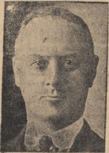
Anglja stworzyła nowe minist. obrony krsja i powierzyła tę rolę sir Thomasowi Inskip.