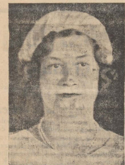
KSIEŻNICZKA EUGENIA GRECKA, domniemana przyszła królowa Anglij.