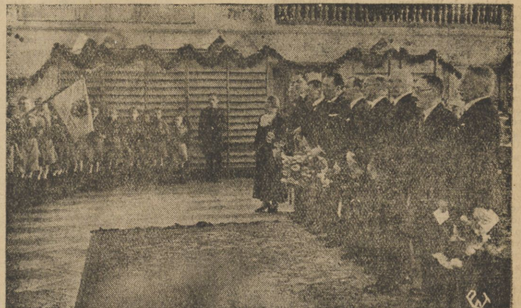
W Warszawie szwedzki minister oświaty Engberg zwiedził w towarzystwie ministra W. R. i O. P. Jędrzejewicza i szeregu dygnitarzy szkolnych kilka zakładów średnich i wyższych. Na zdjęciu — działka szkolna jednej ze szkół powszechnych w Warszawie wita serdecznie miłych gości.

Zwycięstwo to daje Paragwajczykom nową przewagę nad Boliwią w walce o Gran Chaco. Poseł Paragwaju w Buenos Aires oświadczył że mimo wielkie zwycięstwo stanowisko Paragwaju w sporze o Gran Chaco pozostanie bez zmian.