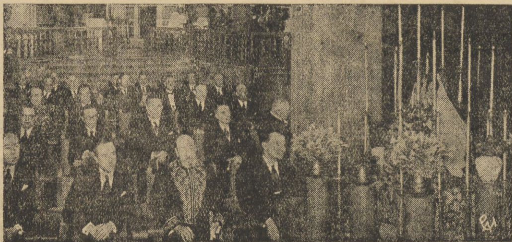
W katedrze w Meksyku odbyło się uroczyste nabożeństwo żałobne za duszę Marszałka Józefa Piłsudskiego, na które przybyli przedstawiciele władz, korpus dyplomatyczny oraz kolonja polska. Na zdjęciu — (na lewo) korpus dyplomatyczny akredytowany przy rządzie mek sykańskim podczas nabożeństwa żałobnego. Na prawo — symboliczny katafalk ustawiony w katedrze podczas nabożeństwa.