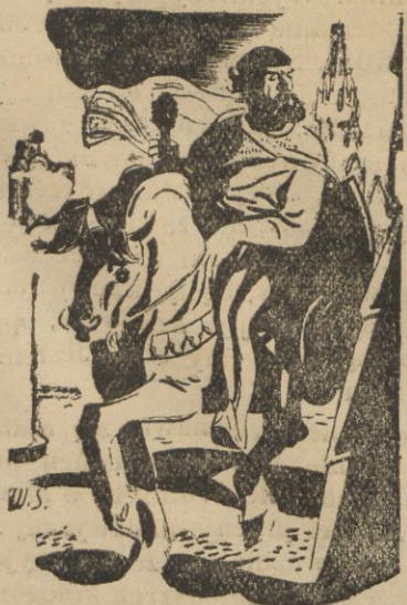
FRAGMENT SLUCHOWISKOWY W RADIO 12. VI. O GODZ. 18.00