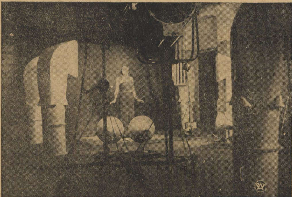
W rozgłośni wieży Eiffla rozpoczęły się próbne transmisje telewizyjne. Na zdjęciu — wnętrze stacji telewizyjnej podczas zdjęć.