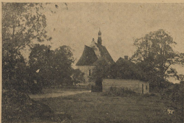
Kościół parafjalny w Strawczynie, rodzinnej wsi Stefana Żeromskiego, w którym był ochrzczony przyszły wielki pisarz.