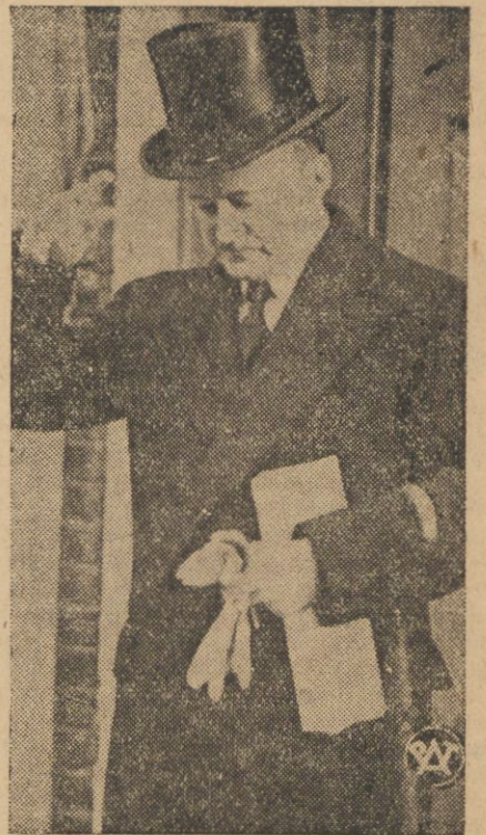
Nowy angielski minister wojny A. Duff Cooper.

lini zwrócił się z apelem do deleg., by czuwała nad obroną włoch przed sankcjami. Przyjęcie to miało charakter niezwykle uroczysty. Na prowincji powstało 94 komitety, złożone z Włosek, których synowie lub mężowie polegli w wojnie światowej. Na czele każdego komitetu stoi sekretarka kobiecej organizacji faszystowskiej.