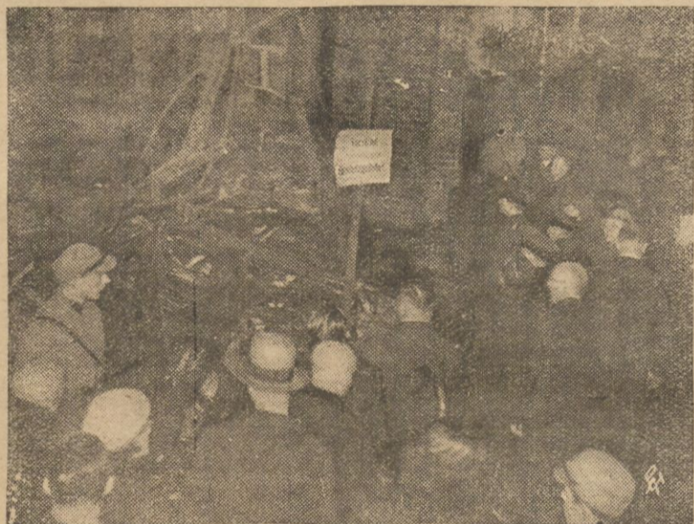
Władze policyjne miasta Berlina zezwoliły na zwiedzanie spalonego Reichstagu przez mieszkańców Berlina, aby mogli przekonać się o straszliwych zniszczeniach, spowodowanych przez pożar gmachu Reichstagu. Na zdjęciu naszym widzimy salę posiedzeń plenarnych Reichstagu, zniszczoną całkowicie przez pożar.

łamanie w kościach i stawach zwalcza Tegal. We własnym więc interesie wypróbujcie dziś jeszcze, lecz żądajcie zawsze tylko oryginalnych tabletek Tegal. Do nabycia we wszystkich aptekach.